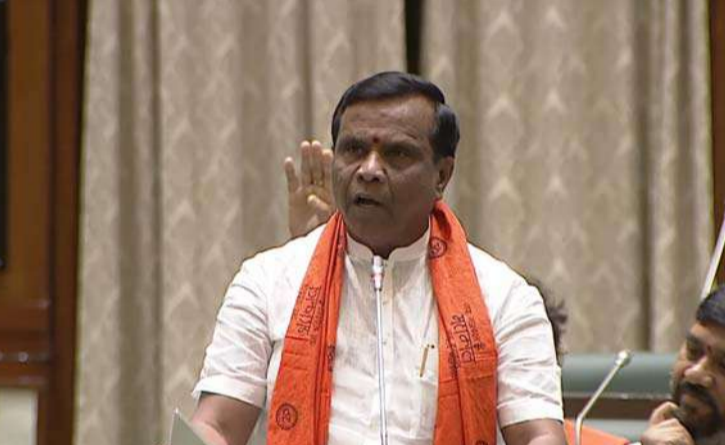
అక్షర విజేత, నిజామాబాద్ ప్రతినిధి