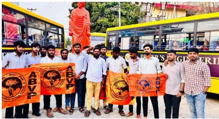
అక్షర విజేత, కుత్బుల్లాపూర్: