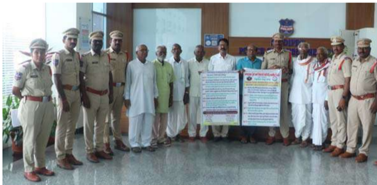
అక్షర విజేత సిద్దిపేట

సిద్దిపేట రూరల్ సీబి శ్రీసు మాట్లాడుతూ పోలీస్ కమిషనర్ ఆదేశానుసారం పయోచ్యుద్ధులకు సంబంధించిన చట్టాల గురించి ఏర్పాటు ఫ్లెక్సీలను ఆవిష్కరించడం జరిగిందని తెలిపారు. ఎవరైనా సరే తల్లిదండ్రులను పయోచ్యుద్ధులను పోషించకుంటే