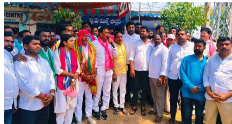
అక్షర విజేత గజ్వేల్ :