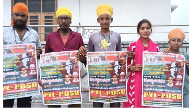
అక్షర విజేత, మోర్లాడ్ :