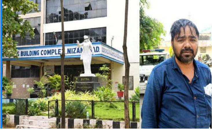
అక్షర విజేత, నిజామాబాద్ ప్రతినిధి :

జిల్లా కోర్టు భవన ఆవరణలో ఓ వ్యక్తి కిరోసిన్ పోసుకున్న ఆత్మహత్యకు యత్నించిన ఘటన కలకలం రేపింది. శనివారం ఉదయం జిల్లా కోర్టు భవన ఆవరణలో నర్సింగ్ అని వ్యక్తి తన ఒంటిపై కిరోసిన్ పోసుకొని ఆత్మహత్యయత్నం చేయగా అక్కడే ఉన్న కోర్టు సిబ్బంది అప్రమత్తమై ఒకటో పోలీస్ స్టేషన్కు సిబ్బందికి అప్పగించారు. ఈ సందర్భంగా ఆత్మహత్యకు యత్నించిన నర్సింగ్ మాట్లాడుతూ తన తండ్రి వ్యవసాయ శాఖలో పనిచేస్తూ మృతి చెందడం జరిగిందని, అయితే కారణం నిరూపకంలో తనకు రావాల్సిన ఉద్యోగం నా సోదరుడు ఇబ్బంది పడుతున్నాడని ఇబ్బించడం జరిగిందన్నారు. తనకు ఉద్యోగం ఇప్పిస్తే కొంత డబ్బు ఇస్తానని నా సోదరుడు మాట ఇచ్చాడని, తాను డబ్బులు ఇవ్వాలని అడిగినా ఇవ్వకుండా ఇబ్బందులు గురి చేస్తున్నాడని ఆవేదనతో ఆత్మహత్యకు పాల్పడుతున్నారని ఆయన అన్నారు. తాను ఆటో నడుపుకుంటూ జీవనం కొనసాగిస్తున్నానని, ఉద్యోగం ఇప్పిస్తే తర్వాత నాకు డబ్బులు ఇయాల్సింది ఇవ్వకుండా చాలా ఇబ్బందులు గురి చేస్తున్నాడని, కోర్టు ఆవరణలో ఆత్మహత్య చేసుకుంటే న్యాయం జరుగుతుందని ఈ సంఘటనను పాల్పడినాని ఆయన పోలీసులకు తన ఆవేదన గోడు వెల్లడోసుకున్నాడు.