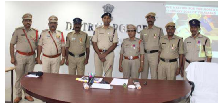
అక్షర విజేత, వికారాబాద్ ప్రతినిధి