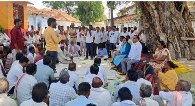
అక్షర విజేత బిచ్చంద

బిచ్చంద మున్సిపాలిటీలో గోపం పల్లి గ్రామాన్ని కలవరద్దని గ్రామస్థుల ఆందోళన గ్రామస్థుల అభిప్రాయాన్ని సేకరించిన అధికారులు