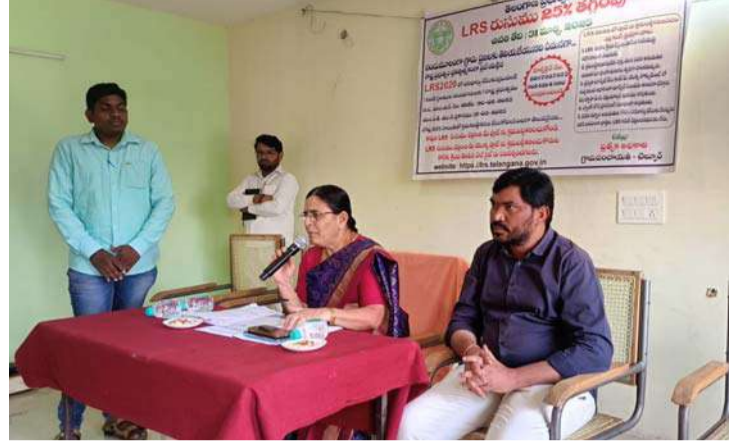
అక్షర విజేత గణపరం: