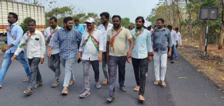
అక్షర విజేత గజ్వేల్: