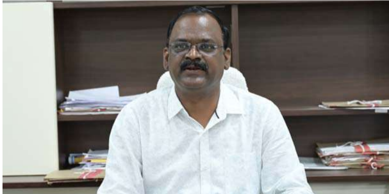
అక్షరవిజేత, వికారాబాద్ ప్రతినిధి