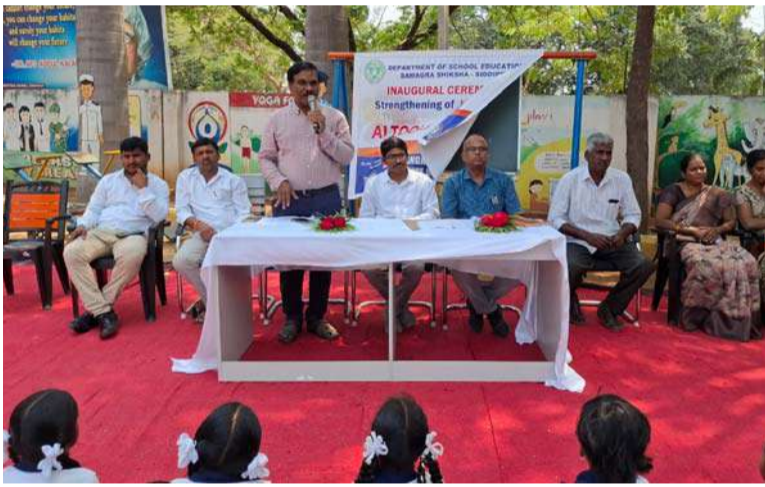
అక్షర విజేత గజ్వేల్ :