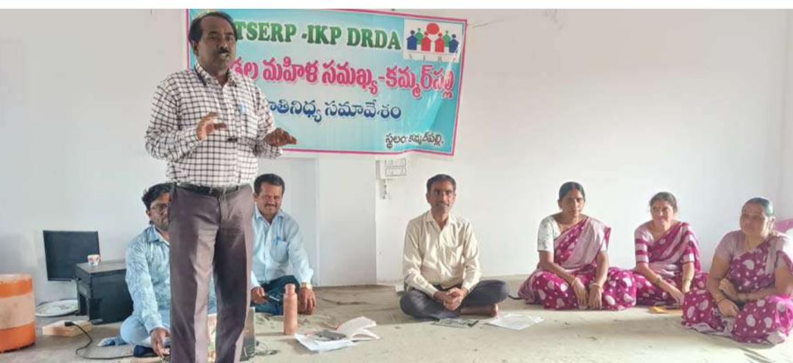
అక్షర విజేత, మోర్లాడ్.