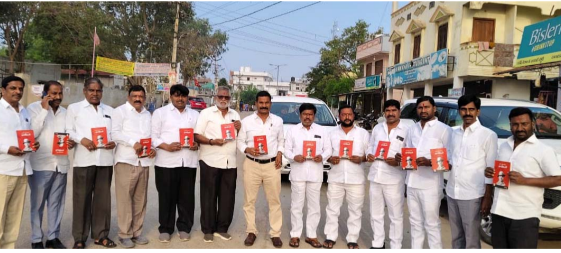
అక్షర విజేత మహేశ్వరం

నేడు మృతవీరుల దినోత్సవం. ఈ సందర్భంగా మహేశ్వరం నియోజకవర్గం లో భగత్ సింగ్ బుక్ ప్రతి ఒక్కరు