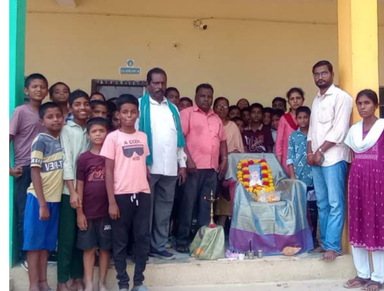
అక్షర విజేత, మోర్రాడ్.