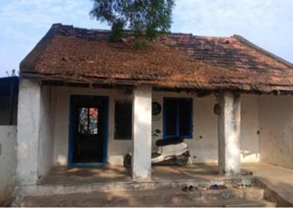
అక్షర విజేత మామడ:

మండలంలోని బండర్ ఖానాపూర్ గ్రామంలో ప్రాథమిక పాఠశాల శిథిలంపన్నకు చేరింది. కాగా పాఠశాలలో అయిదవ తరగతి వరకు ఇరవై అయిదు మంది విద్యార్థులు చదువుకుంటున్నారు. పాఠశాల భవనం పాతబడటంతో వర్షాలు కురిసినప్పుడు భవనం కూలుతుందేమోనని విద్యార్థులు భయపడుతున్నారు. ప్రభుత్వం స్పందించి పాఠశాలకు నూతన భవనం మంజూరు చేయాలని కోరుతున్నారు.