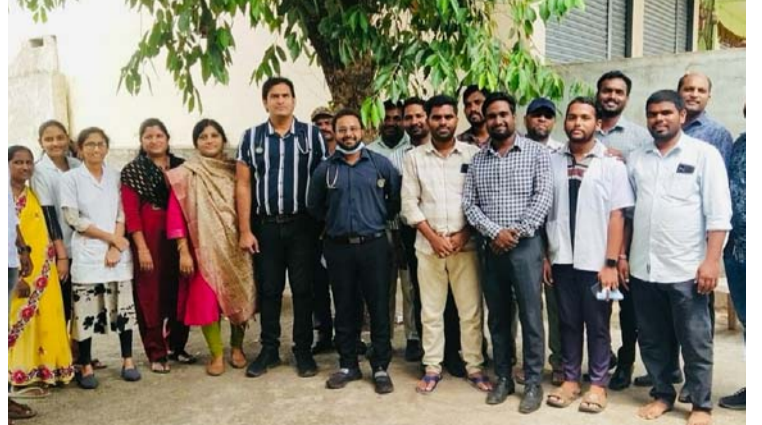
అక్షర విజేత, చొప్పదండి :