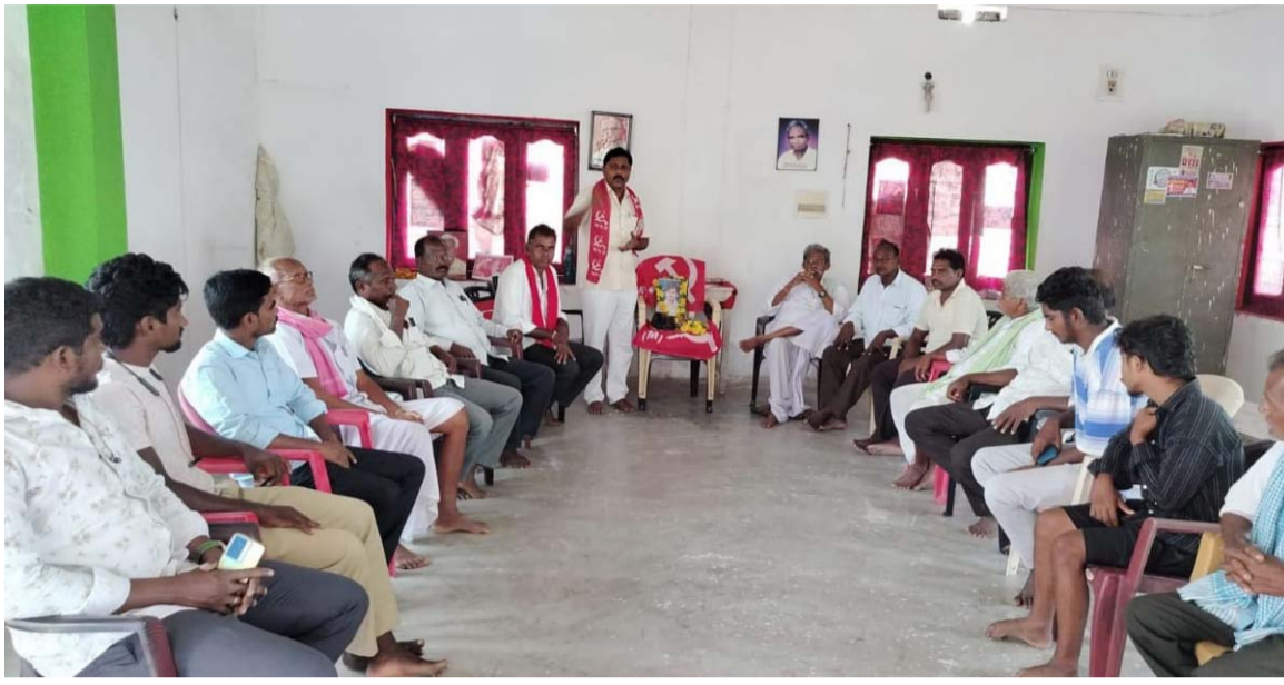
అక్షర విజేత గండేపల్లి

మండల కేంద్రంలో ఎమ్మెస్ జివనంలో రానియిగూడెం గ్రామంలో భగత్ సింగ్ 93వ వర్ధంతి ఘనంగా నిర్వహించడం జరిగింది ఈ కార్యక్రమాన్ని