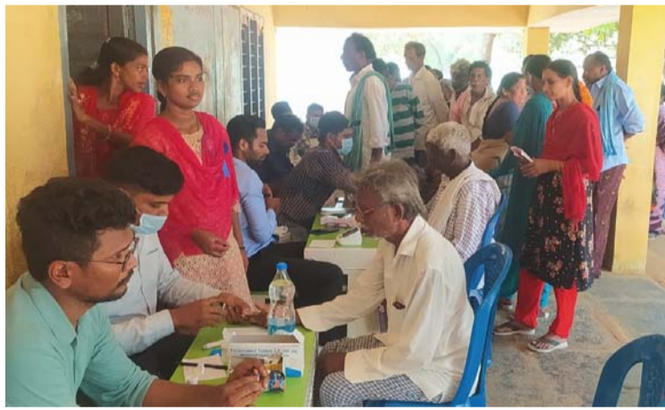
అక్షర విజేత గండపల్లి