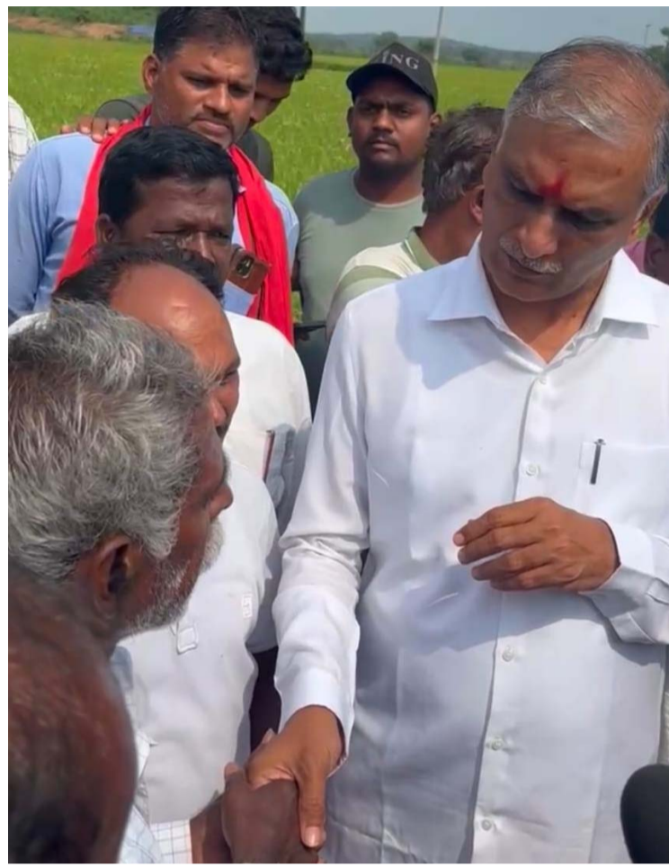
అక్షర విజేత సిద్దిపేట

లక్ష్మీదేవి పల్లి గ్రామంలో శనివారం రాత్రి కురిసిన అకాల వడ గండ వానకు నష్టపోయిన పంటను పరిశీలించిన మాజీ మంత్రి ఎమ్మెల్యే హరీష్ రావు, హరీష్ రావు మాట్లాడుతున్న వడ గండ వాన వల్ల పంట నష్టం జరిగింది. రైతులను వెంటనే ప్రభుత్వం ఆదుకోవాలి కాంగ్రెస్ ప్రభుత్వం రైతులను దగా చేస్తుంది రెండు లక్షల రుణమాఫీ చేస్తామని కాంగ్రెస్ ప్రభుత్వం మోసం చేసింది. రైతులకు రూపంలో కేసీఆర్ రైతులకు నేరుగా సహాయం చేశాడు. వాన కాలం యానంగి రైతులందరి 15000 వెంటనే విడుదల చేయాలి. పంటల భీమా ఉండి ఉంటే రైతులకు ఇంత నష్టం ఉండేది కాదు రైతులకు మూడు పంటల బీమా రాలేదు. రుణమాఫీ చేయలేదు కానీ ఇచ్చామని అసెంబ్లీలో అబద్ధాలు మాట్లాడుతున్నారు. రేవంత్ రెడ్డి అన్ని అబద్ధాలు ఆడుతున్నారు. ఎండల వల్ల పంటలు ఎండడం లేదు కాంగ్రెస్ అసెంబ్లీ పాలన వల్ల నీళ్లులేక పంటలు ఎండిపోతున్నాయి. ఇది కాలం తెచ్చిన కరువు కాదు. కాంగ్రెస్ ప్రభుత్వం తెచ్చిన కరువు. వడ గండ వాన వల్ల నష్టపోయిన రైతులకు వెంటనే ఆర్థిక సాయం చేసి అదుకోవాలి వ్యవసాయ శాఖ అధికారులు క్షేత్రస్థాయిలో పర్యటించాలి.