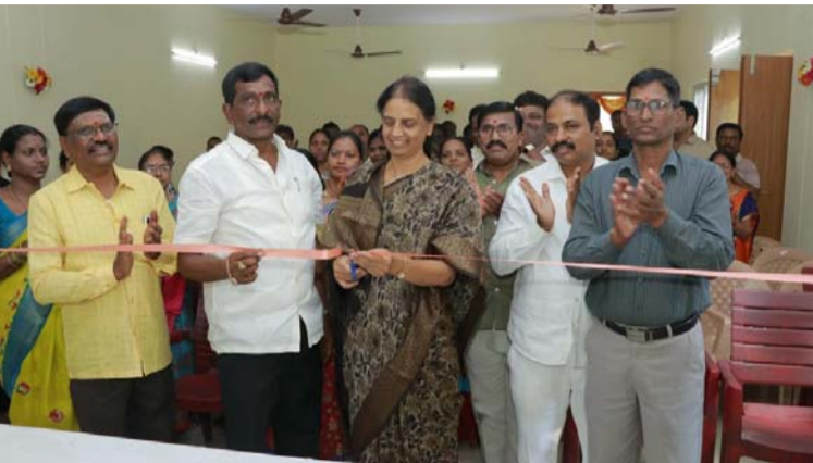
అక్షర విజేత, మహేశ్వరం

మహేశ్వరం నియోజకవర్గంలోని బదంగోట్ మున్సిపల్ కార్పొరేషన్ 1వ డివిజన్ నవయుగ కాలనీలో సీసీ కెమెరాలను ప్రారంభించిన మహేశ్వరం ఎమ్మెల్యే, మాజీ మంత్రి సబితా ఇంద్రారెడ్డి మాట్లాడుతూ ప్రజల భద్రత శాంతి భద్రతల పరిరక్షణ కోసం చేపట్టిన గొప్ప కార్యక్రమం అని కమ్యూనిటీలో విశ్వాసాన్ని పెంచుతాయి. సీసీ కెమెరాలు దొంగతనాలు, ఆపాఠిక కార్యకలాపాలను