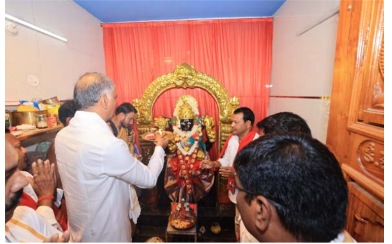
అక్షర విజేత సిద్దిపేట

పెద్దమ్మ, రోజుక ఎల్లమ్మ దీవెనలతో అన్నింటా శుభం చేకూరాలి సిద్దిపేట పట్టణం లోని పెద్దమ్మ, రోజుక ఎల్లమ్మ అమ్మవార్లను దర్శించుకున్న మాజీ మంత్రి ఎమ్మెల్యే హరీష్ రావు