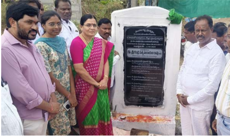
అక్షర విజేత, గణపురం:

గణపురం మండలంలోని వివిధ గ్రామాల్లో భూపాలపల్లి ఎమ్మెల్యే గండ్ర సత్యనారాయణ రావు పర్యటించారు. రూ. 13.35 కోట్లతో వివిధ అభివృద్ధి పనులకు శంకుస్థాపనలు చేశారు. లక్షార్థిపల్లి, బుర్రకాయలగూడెం గ్రామాల్లో ఇందిరమ్మ ఇళ్ల నిర్మాణ పనులకు శంకుస్థాపన చేశారు. గణపురం గ్రామ పంచాయతీలో రూ. 6,91,26,525 విలువైన జంట్ల చెక్కును మహిళా సంఘాలకు అందజేశారు. మహిళల ఆర్థిక సాధికారతకు ప్రజా ప్రభుత్వం అన్ని విధాలా ఆందోగం ఉంటుందన్నారు. మునుపెన్నడూ లేనివిధంగా మొదటిసారి మహిళా సంఘాలకు రుణ ఖాతా ప్రమాద ఖాతా పథకాన్ని ప్రవేశపెట్టింది ప్రజా ప్రభుత్వమని ఎమ్మెల్యే ఈ సందర్భంగా అన్నారు. అభివృద్ధి పనులు మైలారం ఎస్సీ కాలనీలో రూ. 9 లక్షలతో సీసీ రోడ్డు నిర్మాణ పనులకు, రూ. 300 లక్షలతో పీడబ్ల్యుడి రోడ్డు అయోధ్యపూర్ వరకు బీడీ రోడ్డు నిర్మాణ పనులకు శంకుస్థాపన చేశారు. గాంధీనగర్ లో రూ. 4 లక్షలతో సీసీ రోడ్డు, రూ. 10