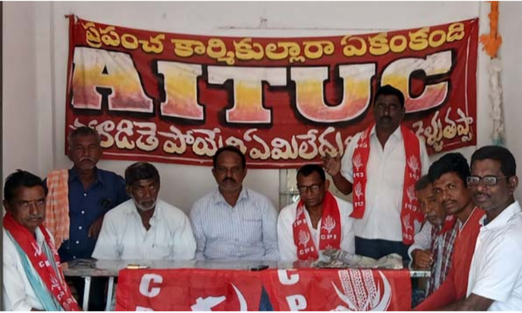
అక్షర విజేత గండిపల్లి

అసెంబ్లీ ఎన్నికల సమయంలో కాంగ్రెస్ పార్టీ, బ్యాంకులలో రైతులు ఎంత మొత్తం బుణం తీసుకున్నా కాంగ్రెస్ రెండు లక్షల వరకు మాఫీ చేస్తామని