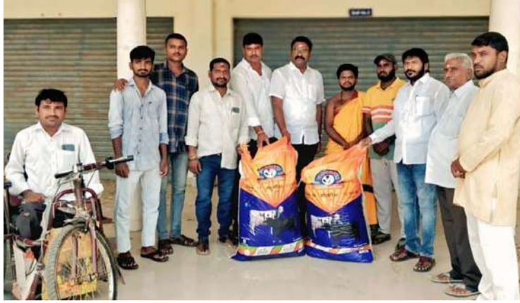
అక్షర విజేత, గణపరం: