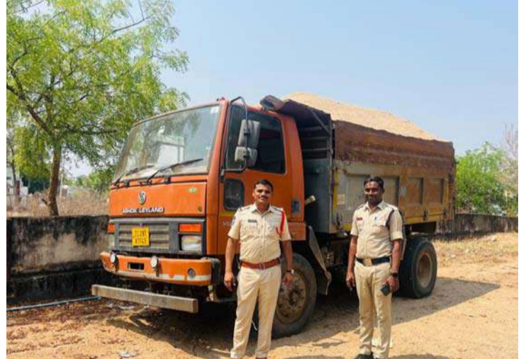
అక్షర విజేత ఇల్లంతకుంట: