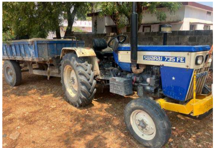
అక్షర విజేత ఇల్లంతకుంట: