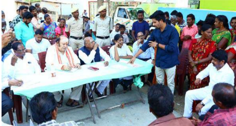
అక్షర విజేత, వేములవాడ / సిరిసిల్ల ప్రతినిధి :