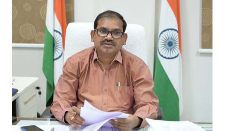
అక్షర విజేత, వికారాబాద్ ప్రతినది

రైతులకు ఎలాంటి ఇబ్బందులు లేకుండా 2024-25 రబీ సీజన్ కు సంబంధించిన వరి ధాన్యం కొనుగోలుకు పకడ్బందీ చర్యలు చేపట్టాలని జిల్లా అదనపు కలెక్టర్ లింగాయక్ అధికారులకు సూచించారు. బుధ వారం కలెక్టరేట్ తన ఛాంబర్ నందు రబీ సీజన్ వరి ధాన్యం కొనుగోలు కేంద్రాల వద్ద చేపట్టాల్సిన ఏర్పాట్లపై సమావేశము నిర్వహించారు. ఈ సందర్భంగా మాట్లాడుతూ రబీ లో వరి