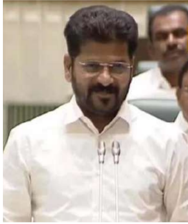
ఆ భూమిని స్వాధీనం చేసుకున్నామని తెలిపారు.