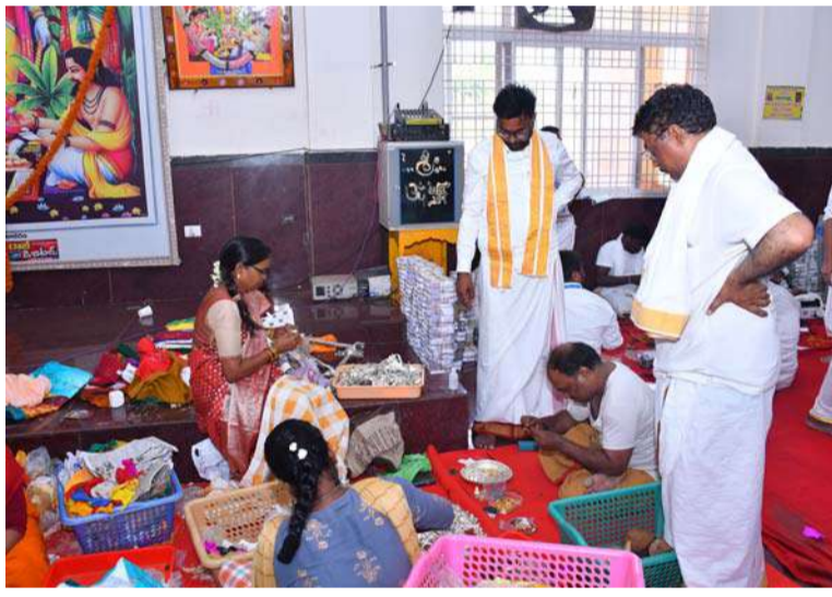
తెలుపారు. ఆలయ అనువంశిక ధర్మకర నరసింహ మూర్తి, ఆలయ అధికారులు, ఆలయ సిబ్బంది, ఎస్సీఎఫ్ సిబ్బంది, తదితరులు పాల్గొన్నారు.