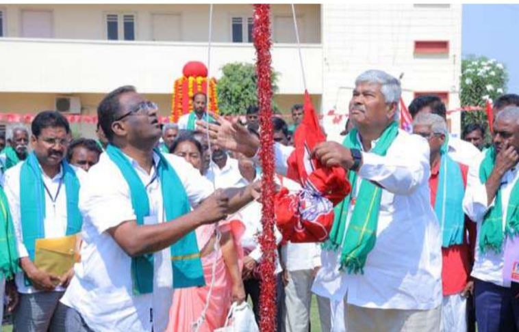
అక్షర విజేత, నిజామాబాద్ ప్రతినంది