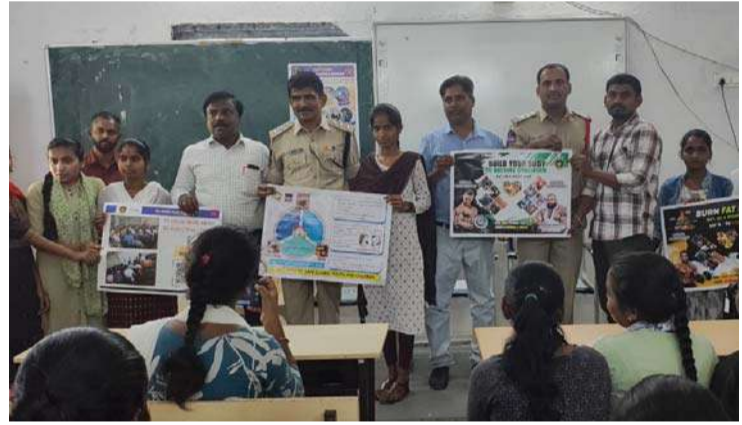
అక్షర విజేత బిచ్చంపాడు