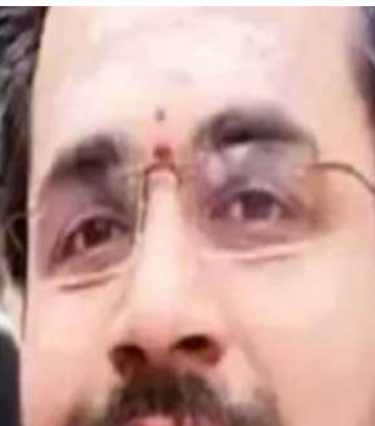
అక్షర విజేత రాజేంద్రనగర్