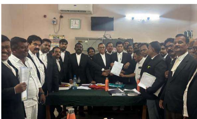
అక్షర విజేత, నిజామాబాద్ ప్రతినిధి

నిజామాబాద్ బార్ అసోసియేషన్ 2025-26 వార్షిక సంవత్సరానికిగాను నామినేషన్లు బుద్ధవారం ముగిసినట్లు