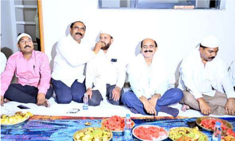
అక్షర విజేత, నిజామాబాద్ ప్రతినిధి :

రంజాన్ మాసాన్ని పురస్కరించుకుని తెలంగాణ గజిబెట్ అధికారుల సంఘం నిజామాబాద్ జిల్లా శాఖ ఆధ్వర్యంలో బుధవారం సాయంత్రం సమీకృత జిల్లా కార్యాలయాల సమదాయం (కలెక్టరేట్) లో ఇష్టార్ విందును ఏర్పాటు చేశారు.