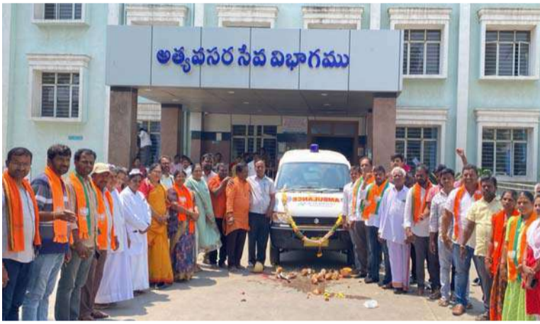
అక్షర విజేత గజ్వేల్: