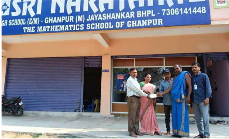
అక్షర విజేత, గణపరం: