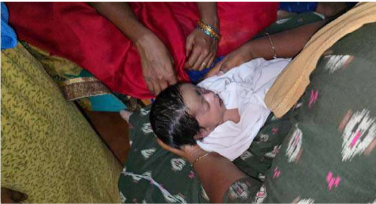
అక్షర విజేత రాజేంద్రనగర్

పసిబడ్డను గదిలో పడుకోబెట్టి స్నానానికి వెళ్ళింది తల్లి తిరిగి వచ్చి చూసే సరికి పాప మంచం పై కనిపించలేదు. పసిబడ్డ తల్లి చుట్టుపక్కల గాలింపు ఒక బకెట్ లో పాప నీళ్లలో పడి మృతి చెందిన ఘటన కేసు నమోదు చేసి దర్యాప్తు చేస్తున్న మైలర్ దేవ్ పల్లి పోలీసులు