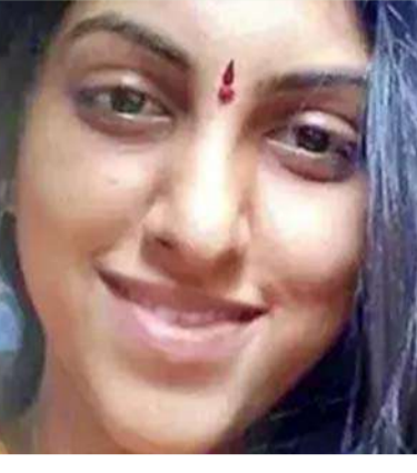
అక్షర విజేత రాజేంద్రనగర్

పూజాల సాయి కృష్ణకు జీవిత ఖైదు... మరో ఏడేళ్లు జైలు శిక్ష