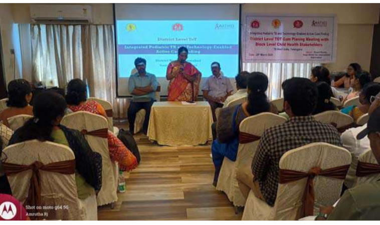
అక్షర విజేత, నిజామాబాద్ ప్రతినంది :

జిల్లా వైద్య ఆరోగ్యశాఖ, టి బి అలర్డ్ ఇండియా ఆధ్వర్యంలో పిల్లల్లో క్షయ వ్యాధి నిర్మూలనపై శిక్షణ కార్యక్రమం ను