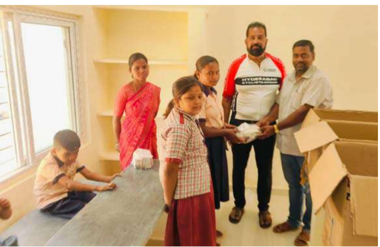
అక్షర విజేత, దుండీగల్ :-