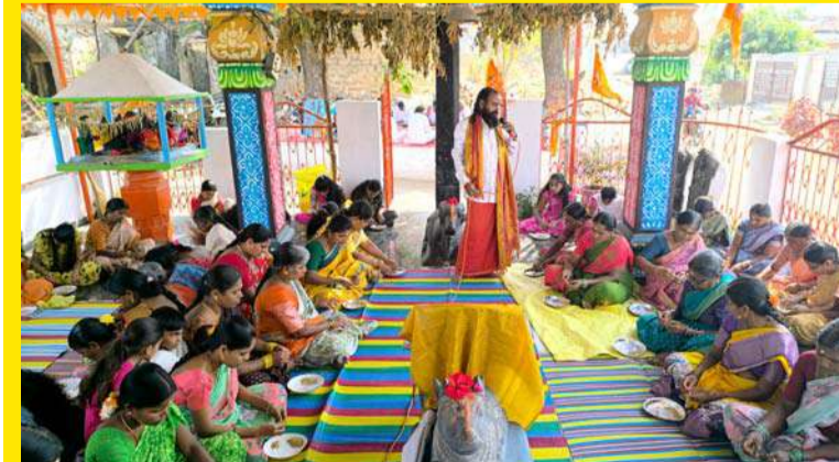
అక్షర విజేత గజ్వేల్ :

భాజ భజంత్రిలతో తలంబ్రాలను దేవాలయానికి తీసుకెళ్లారు మొదటిసారిగా మా గ్రామానికి తలంబ్రాలు రావడం అదృష్టమన్నారు రామకోటి రామరాజును సన్మానించిన మంగోల్ గ్రామస్థులు