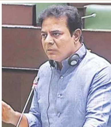
బాధ్యత ప్రజాపతినిధులుగా అందరిపై ఉందని అన్నారు. ఈ విషయంలో పార్టీ అందరి

అక్షర విజేత, హైదరాబాద్: అసెంబ్లీ సమావేశాల్లో భాగంగా చివరి రోజు గురువారం అవయవ దానం బిల్లును స్పీకర్ గడ్డం ప్రసాద్ కుమార్ అనుమతితో వైద్య, ఆరోగ్య శాఖ మంత్రి దామోదర రాజనర్సింహ ప్రవేశపెట్టారు. ఈ క్రమంలో బిల్లుపై చర్చ సందర్భంగా బీఆర్ఎస్ వర్గం ప్రెసిడెంట్, మాజీ మంత్రి కేటీఆర్ మాట్లాడుతూ.. అవయవ దానం బిల్లుకు బీఆర్ఎస్ తరపున తాము సంపూర్ణ మద్దతును ఇస్తున్నామని ప్రకటించారు. రాష్ట్ర వ్యాప్తంగా జీవన్ దానం ద్వారా 3,724 మంది బాధితులు ఆర్గాన్స్ కోసం దరఖాస్తు చేసుకున్నారని పేర్కొన్నారు. రాష్ట్రంలో అవయవ దానానికి అందరినీ ప్రోత్సహించే