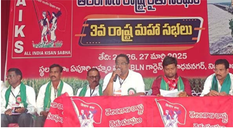
అక్షర విజేత, నిజామాబాద్ ప్రతినిధి

తెలంగాణ రాష్ట్ర రైతు సంఘం మూడవ మహాసభలు విజయవంతంగా పూర్తయ్యాయని నిజామాబాద్ లో రాష్ట్ర