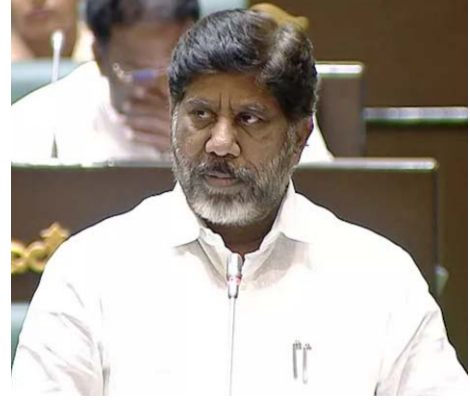
శాతం నిధులు చేకూరాయి. 2023-24లో వడ్డీల చెల్లింపుల కోసం రూ. 24,347 కోట్లు, వేతనాలకు రూ. 26,981 కోట్లు ఖర్చు అయింది.

అక్షర విజేత, హైదరాబాద్: తెలంగాణ ఉప ముఖ్యమంత్రి భట్టి విక్రమార్క శాసనసభలో కాగ్ నివేదికను ప్రవేశపెట్టారు. 2023-24 ఆర్థిక ఏడాది పైనాన్స్ అకౌంట్స్, ఆఫ్రోప్రియేషన్ అకౌంట్స్ పై కాగ్ నివేదిక సమర్పించారు. ఇందులో 2023-24 బడ్జెట్ అంచనా రూ. 2,77,690 కోట్లు, చేసిన వ్యయం రూ. 2,19,307 కోట్లుగా పేర్కొన్నారు. బడ్జెట్ అంచనాలో 79 శాతం వ్యయం అయిందని తెలిపారు. ఆమోదం పొందిన బడ్జెట్ కంటే అదనంగా అంచనాలో 33 శాతం ఖర్చు అయింది. ఖజానాకు పన్ను ఆదాయం నుంచే 61.83