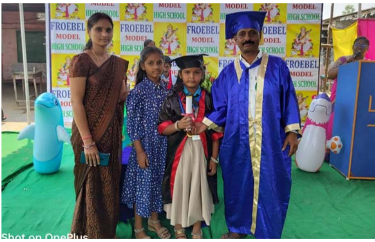
అక్షర విజేత, గణపూరం:

గణపూరం మండల కేంద్రంలోని ప్రోబెల్ మోడల్ హై స్కూల్లో ఘనంగా గ్రాడ్యుయేషన్ డే, ఓ.పెన్ హౌస్ వేడుకలను ఘనంగా నిర్వహించారు. నర్సీ, ఎల్ కేజీ, యూకేజీ, విద్యార్థిని, విద్యార్థులకు ఓ.పెన్ హౌస్ ప్రోగ్రాం అకాడమీ లో బోధించిన పాఠ్యాంశాలు చార్జ్ డెమో ప్రదర్శనలు