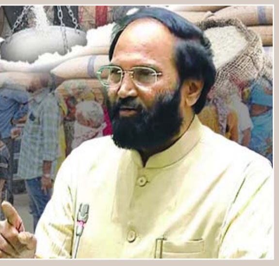
ఆరోపణల నేపథ్యంలో రాష్ట్రంలోని తెల్లరేషన్ కార్డు ఉన్న కుటుంబాల్లో ప్రతి ఒక్కరికీ 6 కిలోల సన్న బియ్యాన్ని అందించనున్నామని చెప్పారు. రాష్ట్ర జనాభాలో 84 శాతం మందికి ఆవార భద్రత కల్పిస్తున్నామని

అక్షర విజేత, హైదరాబాద్: తెల్ల రేషన్ కార్డు దారులకు ఉగాది నుంచి సన్న బియ్యం ఇవ్వనున్నట్లు పౌరసరఫరాల శాఖ మంత్రి ఉత్తమకుమార్ రెడ్డి తెలిపారు. బుధవారం శాసనసభలో జరిగిన వివిధ శాఖల పద్ధతులపై చర్చ సందర్భంగా మంత్రి సమాధానమిస్తూ.. రాష్ట్రంలో 89.1 లక్షల రేషన్ కార్డులకు ఏటా 24 లక్షల మెట్రిక్ టన్నుల పీడీఎస్ బియ్యాన్ని అందిస్తున్నామని చెప్పారు. అయితే ఆ బియ్యం పక్కదారి పడుతున్నాయనే