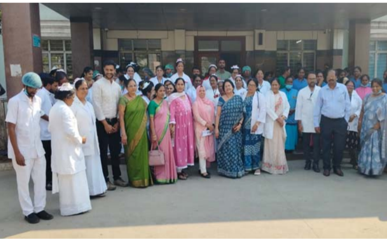
అక్షర విజేత గజ్వేల్:

- అసిస్టెంట్ నిర్వహించిన గోల్కొండ ప్రభుత్వ దావకాన వైద్యులు