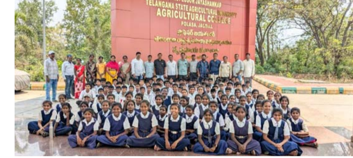
అక్షర విజేత, ఏర్లట్ల :