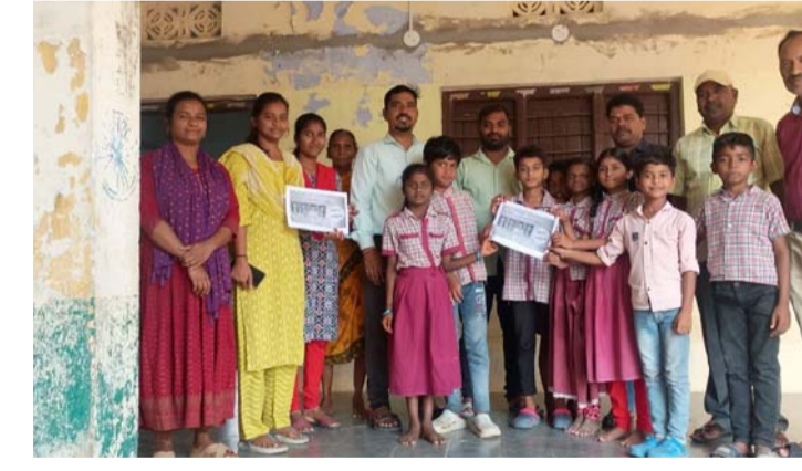
అక్షర విజేత, ఏర్లట్ల :