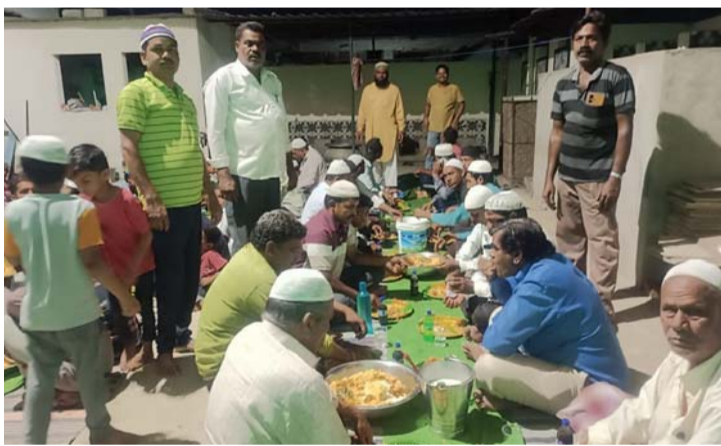
అక్షర విజేత, ఏర్లపల్లి :