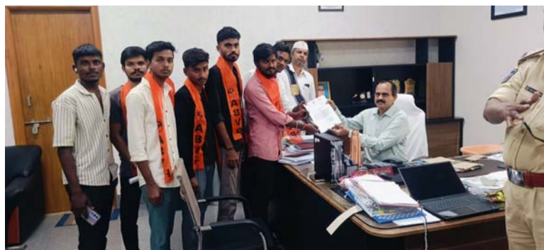
తెలంగాణ రాష్ట్రం పేరు మీద ఉన్న తెలంగాణ యూనివర్సిటీ కి కూడా ఒక ప్రభుత్వ ఇంజనీరింగ్ కళాశాల కచ్చితంగా ఇవ్వాలని పేద విద్యార్థులకు న్యాయం చేయాలని డిమాండ్ చేశారు. ఈ

నిర్మల్, ఆదిలాబాద్, నిజామాబాద్ జిల్లాలకు సంబంధించిన పేద, మధ్యతరగతి విద్యార్థులు పెద్ద చదువులు చదవాలంటే పట్టణానికి వెళ్లడానికి చాలా ఇబ్బందులు పడుతున్నారన్నారు. అలాగే చాలామంది విద్యార్థులు చదువుకు దూరం అవుతున్నారని ప్రభుత్వ ఇంజనీరింగ్ కళాశాలను నిజామాబాద్ జిల్లాకి తెలంగాణ యూనివర్సిటీ పరిధిలో వచ్చేట్లు చర్యలు తీసుకోవాలని డిమాండ్ చేశారు. అలాగే కొట్లాడి తెచ్చుకున్న తెలంగాణ రాష్ట్రంలో