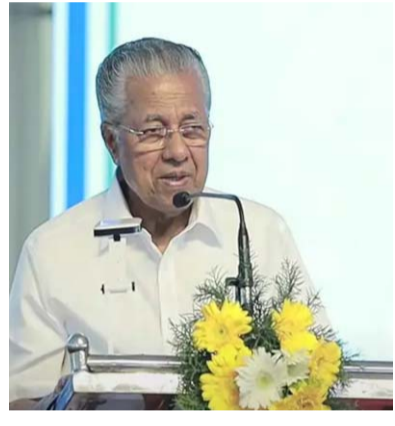
నుంచి దాదాపు రూ.529.50 కోట్ల రుణం మంజూరు చేసిన విషయాన్ని ఈ సందర్భంగా విజయన్ ప్రస్తావించారు. కేంద్రంతో తమకు ఉన్న గత అనుభవాల నుంచి ఇంకేమీ ఆశించలేమన్నారు.

అక్షర విజేత, హైదరాబాద్: కేరళలోని వయనాడ్ లో కొంద చరియలు విరిగిపడి భారీగా ఆస్తి ప్రాణనష్టం వాటిల్లిన ఘటన పెను విషాదం నింపిన విషయం తెలిసిందే. దీంతో ఆక్రమణ బాధిత కుటుంబాల పునరావాసం కోసం నిర్మించనున్న మోడల్ టౌన్ షిప్ కు కేరళ సీఎం పినరయి విజయన్ గురువారం శంకుస్థాపన చేశారు. ఈ సందర్భంగా ఆయన మాట్లాడుతూ.. వయనాడ్ బాధితులకు పునరావాసం కోసం కేంద్రం నుంచి ఇప్పటివరకు ఆర్థిక సాయం అందలేదని వెల్లడించారు. పునరావాస పనులకు కేవలం రుణం మాత్రం అందిందని.. అదీ తగినంతగా రాలేదని ఆవేదన వ్యక్తం చేశారు. పునరావాసం కోసం కేంద్రం తన మూలధన పెట్టుబడి పథకం