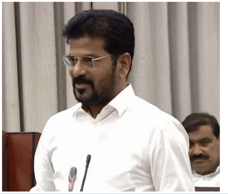
కోరుతున్నానని అన్నారు.. బడ్జెట్ ఆమోద తీర్మానంపై ఆయన మాట్లాడుతూ, గతంలో తనపై జరిగిన అన్యాయాన్ని ప్రస్తావించారు. కొన్ని వ్యక్తులు సలహాలు, సూచనలు ఇవ్వడానికే సిద్ధంగా ఉంటారని, కానీ వాటిని పాటించాల్సిన బాధ్యతను అనుసరించరని

అక్షర విజేత, హైదరాబాద్: తాను కూడా కక్ష సాధింపులకు పాల్పడితే కెసిఆర్ ఎప్పుడో జైలు వెళ్లేవారని ముఖ్యమంత్రి రేవంత్ రెడ్డి వ్యాఖ్యానించారు.. అందర్ని కలుపుకుని ముందుకు సాగాలనే తన అభిమతమని, అందుకే విపక్ష సహకారాన్ని పడవడే