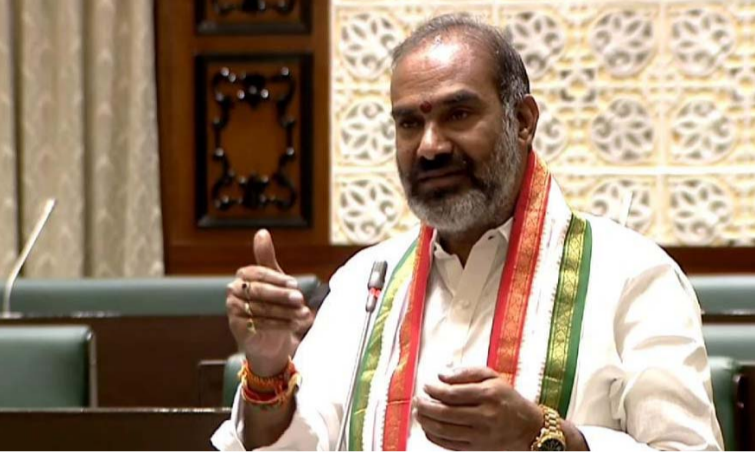
అక్షర విశేష, వేములవాడ / రాజన్న సిరిసిల్ల ప్రతినిధి :

వేములవాడ నియోజకవర్గంలో కొత్తగా ఏర్పడిన మండలాల్లో ప్రభుత్వ కార్యాలయాల నిర్మాణానికి నిధులు మంజూరు చేయాలని ప్రభుత్వ వివ్,