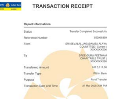
అక్షర విశేష ,శివపేట.