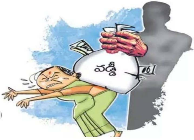
అక్షర విశేష బిచ్చుండ