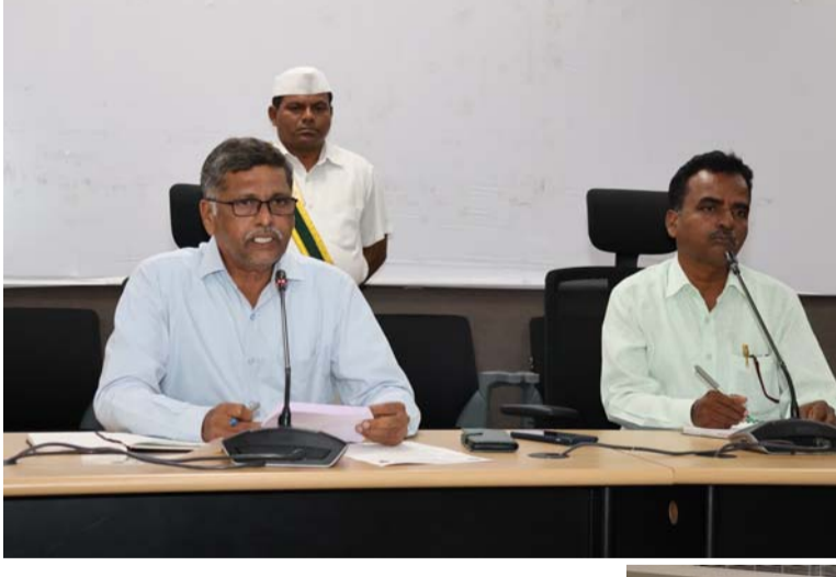
అక్షర విజేత సిద్ధిపేట

గురువారం సమీకృత జిల్లా కార్యాలయ సముదాయంలోని సమావేశ మందిరంలో వచ్చే నేల ఏప్రిల్ - 5 వ తేదీన బాబు జగ్జీవన్ రావు మరియు ఏప్రిల్ - 14 వ తేదీన డా.బిఆర్ అంబేద్కర్ జయంతి ఉత్సవాలు జిల్లా షెడ్యూల్ కులాల అభివృద్ధి శాఖ వారి ఆధ్వర్యంలో నిర్వహించే కార్యక్రమాలపై జిల్లాలోని వివిధ దళిత సంఘాల నాయకులతో జిల్లా అదనపు కలెక్టర్ అబ్దుల్ హమీద్ సమావేశం నిర్వహించారు. ఈ సమావేశంలో జిల్లా అదనపు కలెక్టర్ మాట్లాడుతూ. భరత జాతికి ఎనలేని సేవలు