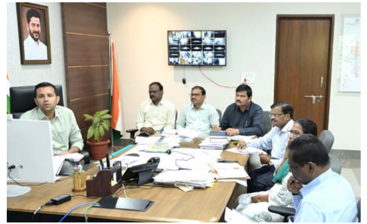
అక్షరవిజేత, వికారాబాద్ ప్రతినిధి