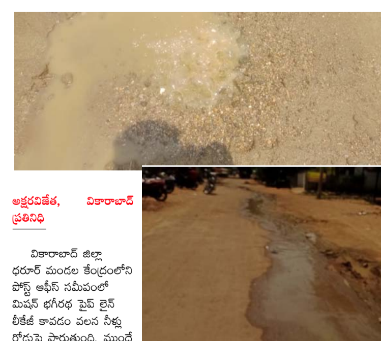
అక్షరవిజేత, వికారాబాద్ ప్రతినిధి

రోడ్డుపై పారుతున్న మిషన్ భగీరథ నీళ్లు ఇబ్బందులు పడుతున్న ప్రజలు పట్టించుకోని మిషన్ భగీరథ అధికారులు