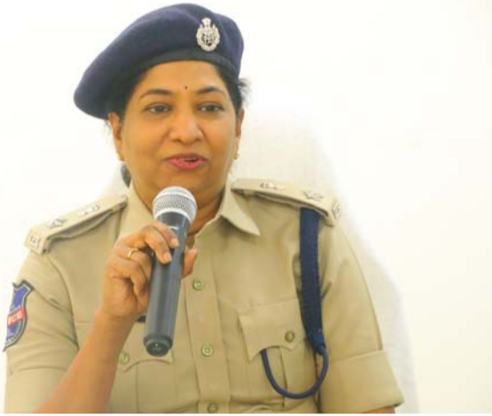
అక్షర విజేత సిద్దిపేట

సిద్దిపేట జిల్లా పోలీస్ కమిషనరేట్ పరిధిలో సిద్దిపేట పోలీస్ కమిషనరేట్ 7 (1), 2016, యాక్ట్ 22 (1) (ఎ) నుండి (ఎఫ్ ) మరియు 22 (2) (ఎ) %ఎ% (బి), %ఎ% 22 (3) సిటీ పోలీస్ యాక్ట్,