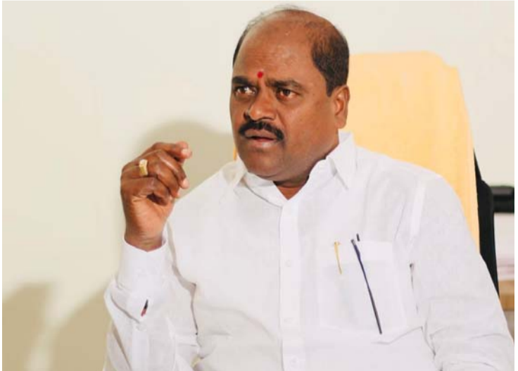
అక్షర విజేత మహేశ్వరం