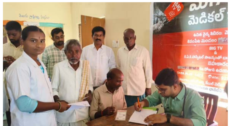
అక్షర విజేత, శివంపేట.