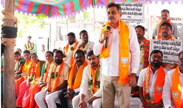
అక్షర విజేత మహోత్సవం