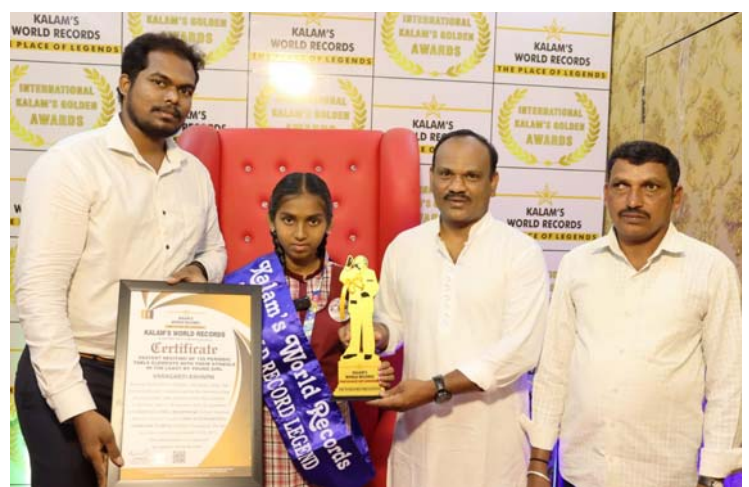
అక్షర విజేత గజ్జెల్ :

భౌతిక -రసాయన శాస్త్రాన్ని అఖండ స్థాయికి చేర్చిన అశ్వినీ