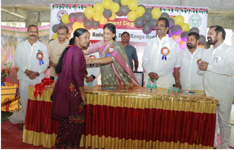
అక్షర విజేత మహోత్సవం

మహోత్సవం నియోజకవర్గంలోని బడంగ్పేట్ మున్సిపల్ కార్పొరేషన్ పాలిటెక్నిక్ కాలేజీలో ఏర్పాటు చేసిన డిగ్రీ కాలేజీ నాలుగో వార్షికోత్సవ కార్యక్రమంలో ముఖ్యఅతిథిగా పాల్గొన్న మాజీ మంత్రి మహోత్సవం ఎమ్మెల్యే సబితా ఇంద్రారెడ్డి, మాట్లాడుతూ మహోత్సవం నియోజకవర్గంలో డిగ్రీ కళాశాల ఏర్పాటు ప్రాముఖ్యతను ప్రస్తావించారు. ఆమె మాట్లాడుతూ, ప్రతి విద్యార్థి ఆర్థిక పరిస్థితులు ఎంతగానో ప్రభావితం చేస్తున్న ప్రస్తుత పరిస్థితుల్లో, ఉచిత విద్య అందించడం ద్వారా సమాన అవకాశాలు కల్పించాలనే లక్ష్యంతోనే మాజీ ముఖ్యమంత్రి కేసీఆర్, కేటీ నంది కీజీ వరకు ఉచిత విద్య