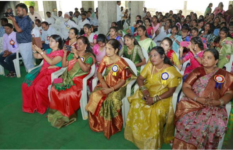
విధానాన్ని ప్రవేశపెట్టారని గుర్తు చేశారు. సబితా ఇంద్రారెడ్డి, ప్రభుత్వ డిగ్రీ

మహోత్సవం నియోజకవర్గంలోని బడంగ్పేట్ మున్సిపల్ కార్పొరేషన్ పాలిటెక్నిక్ కాలేజీలో ఏర్పాటు చేసిన డిగ్రీ కాలేజీ నాలుగో వార్షికోత్సవ కార్యక్రమంలో ముఖ్యఅతిథిగా పాల్గొన్న మాజీ మంత్రి మహోత్సవం ఎమ్మెల్యే సబితా ఇంద్రారెడ్డి, మాట్లాడుతూ మహోత్సవం నియోజకవర్గంలో డిగ్రీ కళాశాల ఏర్పాటు ప్రాముఖ్యతను ప్రస్తావించారు. ఆమె మాట్లాడుతూ, ప్రతి విద్యార్థి ఆర్థిక పరిస్థితులు ఎంతగానో ప్రభావితం చేస్తున్న ప్రస్తుత పరిస్థితుల్లో, ఉచిత విద్య అందించడం ద్వారా సమాన అవకాశాలు కల్పించాలనే లక్ష్యంతోనే మాజీ ముఖ్యమంత్రి కేసీఆర్, కేటీ నంది కీజీ వరకు ఉచిత విద్య