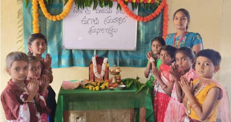
అక్షర విజేత, చందుర్తి / రాజన్న సిరిసిల్ల ప్రతినిధి :