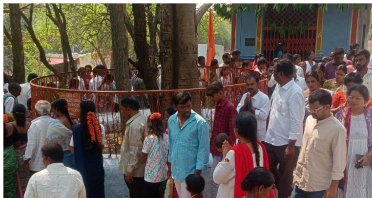
తెల్లవారుజామున నాలుగు గంటల నుండి ప్రారంభమైన సామూహిక తైలాభిషేకాలు

వేలాది భక్తులచే సామూహిక తైలాభిషేకాలు అందుకున్న ఎన్నతల ఈ శనీశ్వర స్వామి కి భక్తులు తండోపందాలుగా తరివచ్చి సామూహిక తైలాభిషేకాలు నిర్వహించారు శనివారం శని అమావాస్య పురస్కరించుకుని మోమిన పేట మండల పరిధిలో ఉన్నటువంటి శంకర్ భారతి మహారాజ్ ఆశ్రమంలో ఉన్నటువంటి శ్రీ శనీశ్వర స్వామికి నల్లని నువ్వుల నూనె నల్లని గుడ్డ ప్రత్యేక తైలాభిషేకాలు నిర్వహించారు