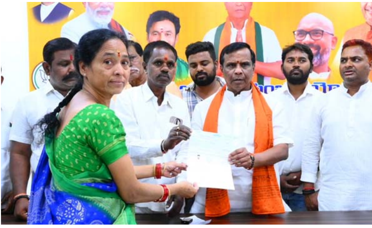
అక్షర విజేత, నిజామాబాద్ ప్రతినిధి :