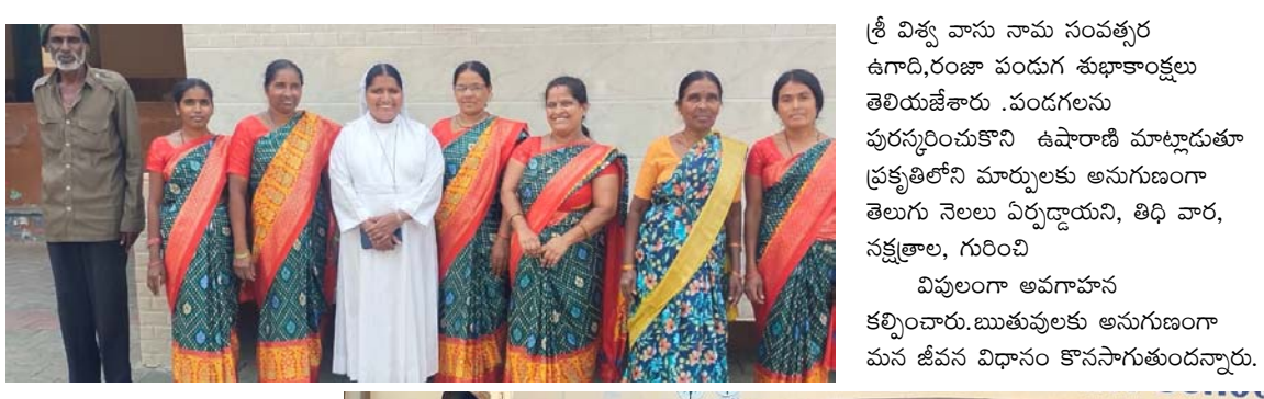
అక్షరవిజేత, వికారాబాద్ ప్రతినిధి