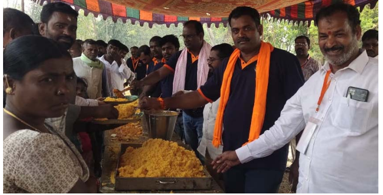
అక్షరవిజేత, వికారాబాద్ ప్రతినిధి

శ్రీ అఖిలభారత అయ్యప్ప సేవా ట్రస్ట్ ఆధ్వర్యంలో అన్నదాన కార్యక్రమం