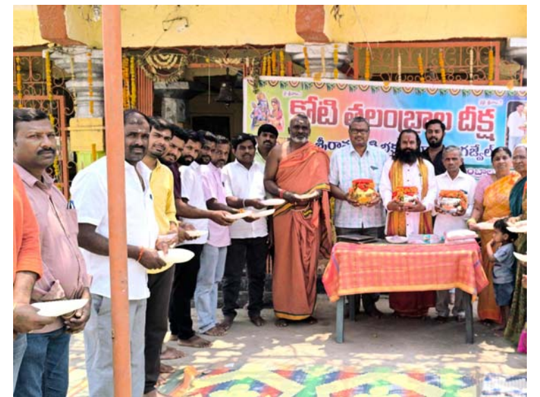
అక్షర విజేత గణ్ణేట్

భద్రాచల రామయ్యకు మా తలంబ్రాలు మా అర్చిష్టమన్నారు. రామకోటి రామరాజు సేవలు అమోఘం అన్న బల్లి శ్రీనివాస్