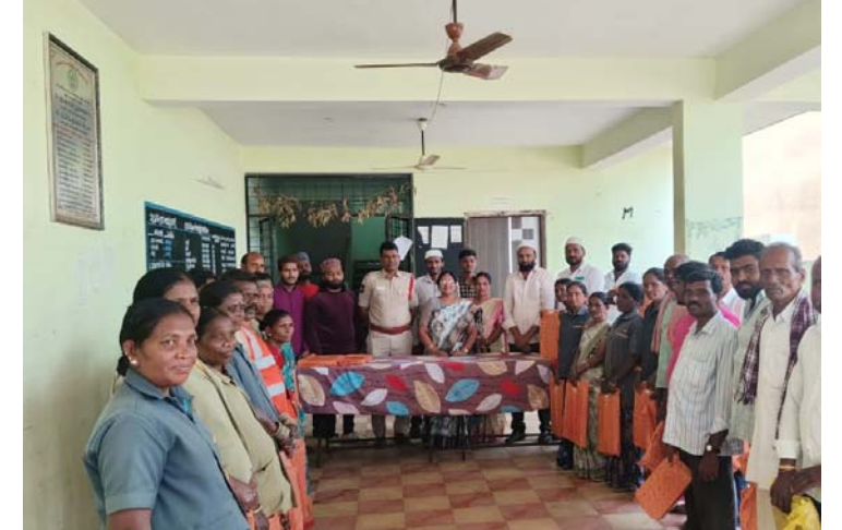
అక్షర విజేత మహేశ్వరం