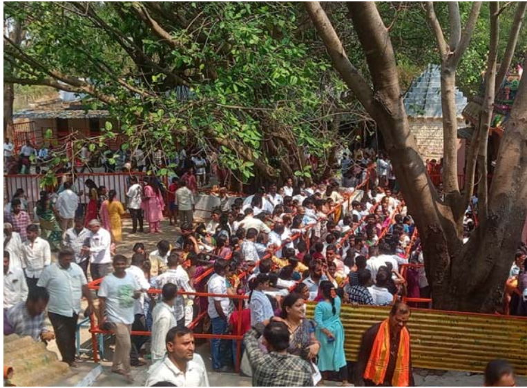
అక్షరవిజేత, వికారాబాద్ ప్రతినిధి

వేలాది భక్తులచే సామూహిక తైలాభిషేకాలు అందుకున్న ఎన్నతల ఈ శనీశ్వర స్వామి కి భక్తులు తండోపందాలుగా తరివచ్చి సామూహిక తైలాభిషేకాలు నిర్వహించారు శనివారం శని అమావాస్య పురస్కరించుకుని మోమిన పేట మండల పరిధిలో ఉన్నటువంటి శంకర్ భారతి మహారాజ్ ఆశ్రమంలో ఉన్నటువంటి శ్రీ శనీశ్వర స్వామికి నల్లని నువ్వుల నూనె నల్లని గుడ్డ ప్రత్యేక తైలాభిషేకాలు నిర్వహించారు