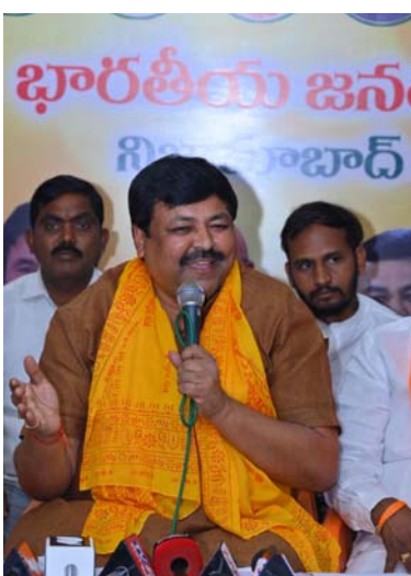
కేటాయించిందని పేర్కొన్నారు. ఈ ప్రోగ్రాం కింద పశువులకు వ్యాక్సిన్ వేయడంతో పాటు, తక్కువ ధరకే మందులు అందించేందుకు పశు ఔషధ కేంద్రాల ఏర్పాటు చేయనుంది. ఈ పథకంలో