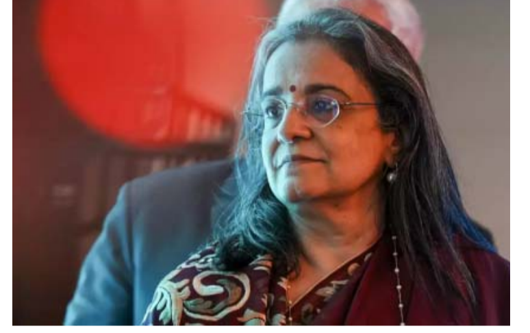
అక్షర విజేత, హైదరాబాద్: