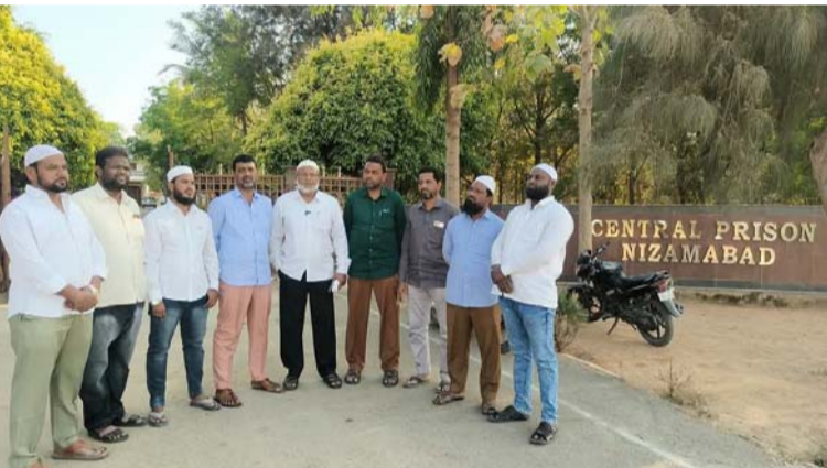
అక్షర విజేత, నిజామాబాద్ ప్రతినిధి :

జైలు సూపరింటెండెంట్ ను కలిసిన ఎంఐఎం పార్టీ నాయకులు