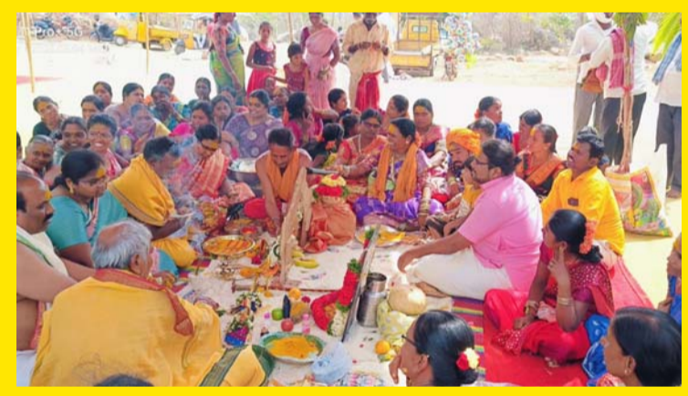
అక్షర విజేత గజ్వేల్ :