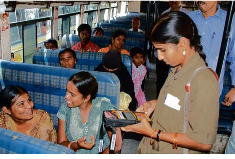
అప్పగించనున్నారు. ఈ బస్సులపై ఇందిరా మహిళా శక్తి ప్రధానమంత్రి చాటి చెప్పేలా

సంఘాలకు అద్దె బస్సుల్ని అందిస్తున్నామని ప్రభుత్వం ప్రకటించింది. ఈనెల 8వ తేదీ మహిళా దినోత్సవం సందర్భంగా సికింద్రాబాద్ లోని పోలీస్ పరేడ్ గ్రౌండ్ వేదికగా 50 బస్సులను ముఖ్యమంత్రి ఏ రేపంత్ రెడ్డి లాంఛనంగా ప్రారంభించనున్నారు. ఈ కార్యక్రమంలో డిప్యూటీ సీఎం మల్లు భట్టి విక్రమార్కు, మంత్రులు సీతక్క, పొన్నం ప్రభాకర్ కూడా పాల్గొంటారని ప్రభుత్వ పర్సనల్ తెలిపాయి. ఒక్కో బస్సు విలువ రూ.36 లక్షలు ఉంటుందనీ, ఒక్కో మండల సమాఖ్యకు ఒక బస్సును కొనుగోలు చేసి ఆర్టీసీకి అద్దె ఇస్తారని వివరించారు. తొలివిడతలో ఉమ్మడి మహబూబ్ నగర్, ఖమ్మం, పరంగల్, కరీంనగర్ జిల్లాల మహిళా సంఘాలకు 150 అద్దె బస్సులను