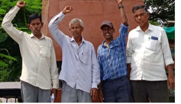
అక్షర విజేత, మోర్లాడ్ :