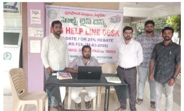
అక్షర విజేత సిద్దిపేట

సిద్దిపేట పట్టణ ప్రజలకు తెలియజేయమని ఏమనగా తెలంగాణ రాష్ట్ర ప్రభుత్వము ఎల్ ఆర్ ఎస్ రుసుముపై 25% తగ్గింపు రాయితీ ప్రకటించడం జరిగినది. కావున ఇట్టి తగ్గింపు రాయితీ 03-నెల 2025 నుండి 31 మార్చి, 2025 వరకు పట్టణ ప్రజలు సద్వినియోగం చేసుకోవాలని కమిషనర్ అశ్రీత్ కుమార్ తెలిపారు. అసెంబ్లీ లో అప్పట్ను మరియు ప్లాట్ల క్రమబద్ధీకరణ కొరతై ఎల్ ఆర్ ఎస్ దరఖాస్తుదారుల కోసం పురపాలక సంఘ కార్యాలయంలో ఏర్పాటు చేసిన హెల్ప్ డెస్క్ పరిశీలించారు. కావున 2020 సంవత్సరములో ఎల్ ఆర్ ఎస్ కోసం దరఖాస్తు చేసుకున్న ప్లాట్లు యజమానులు 31 తారీకు-03 నెల-2025 లోగా 25% రాయితీ సద్వినియోగం చేసుకొని పూర్తి ఫీజు చెల్లించాలని నూచించారు. కావున ఇట్టి 25% రాయితీ అవకాశాన్ని పట్టణ ప్రజలంతా కూడా సద్వినియోగం చేసుకొని మీ యొక్క ప్లాటును క్రమ బద్ధీకరించుకోగలరు. క్రింద తెలిపిన వెబ్ సైట్ ద్వారా ఎల్ ఆర్ ఎస్ దరఖాస్తుదారుల వారి యొక్క దరఖాస్తు ఆన్లైన్ లో ఏ స్థాయిలో ఉన్నది తెలుసుకొనవచ్చును. మరియు ఎల్ ఆర్ ఎస్ దరఖాస్తులపై ఏదైనా సందేహాలు ఉన్నట్లయితే హెల్ప్ డెస్క్ నంబర్ 9505507248 కి సంప్రదించగలరు.