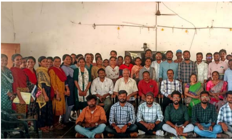
అక్షర విజేత, గణపూరు:

మండల కేంద్రంలోని రైతు వేదికలో రెండు రోజులపాటు నిర్వహించిన భూ, నీటి సంరక్షణ యాజమాన్యం పై నిర్వహించిన