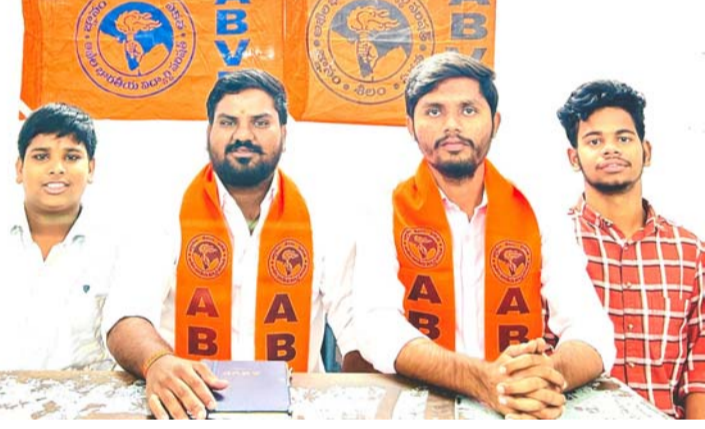
అక్షర విజేత, కుత్బుల్లాపూర్