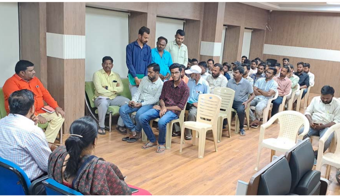
అక్షర విజేత సిద్దిపేట

పట్టణ ప్రజలంతా కూడా సకాలంలో ఇంటి మరియు నీటి పన్నులు చెల్లించి మున్సిపల్ సిబ్బందికి సహకరించాలన్నారు. పన్నులు పన్నులు చేయటకు తక్కువ సమయం ఉన్నందున సిబ్బంది ఉదయాన్నే బకాయిలు ఉన్నవారు ఇంటికి వెళ్లి ఇంటి మరియు నీటి పన్ను పన్నులు చేయాలని సిబ్బందిని అడేశించారు. వార్డు ఆఫీసర్ లు సైతం తమ తమ వార్డులలో తిరుగుతూ బిల్ కలెక్టర్ లతో పన్నులు త్వరితగతిన 100 శాతం పన్ను పన్నులు చేయాలని అడేశించారు. పట్టణ ప్రజలు సైతం