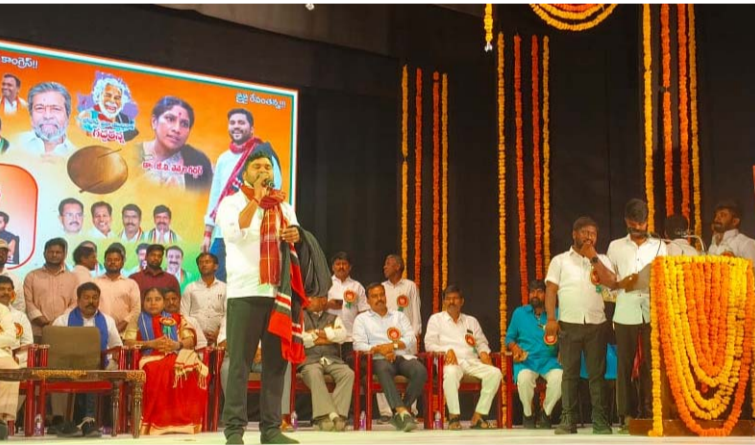
అక్షర విజేత, శివంపేట.