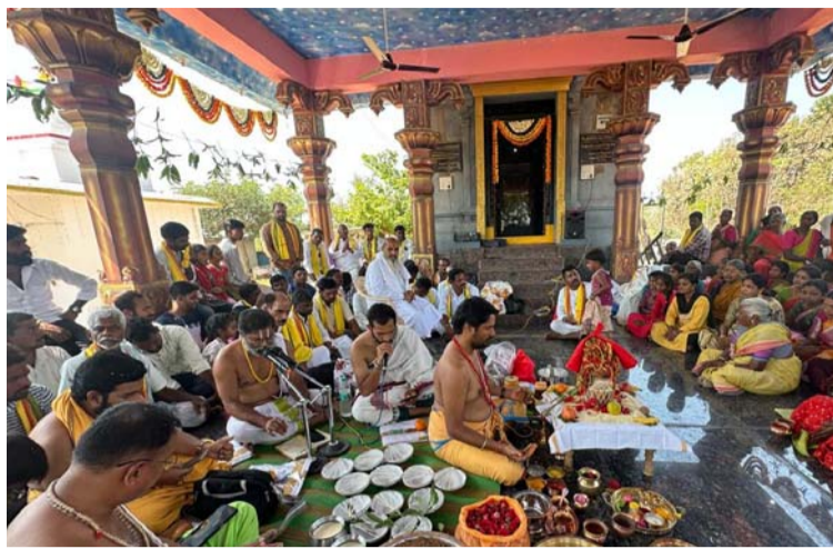
అక్షర విజేత సందిపేట్ :

అంగరంగ వైభవంగా శ్రీ లక్ష్మీ నరసింహ స్వామి విగ్రహ ప్రతిష్ఠాపన వేడుకలు