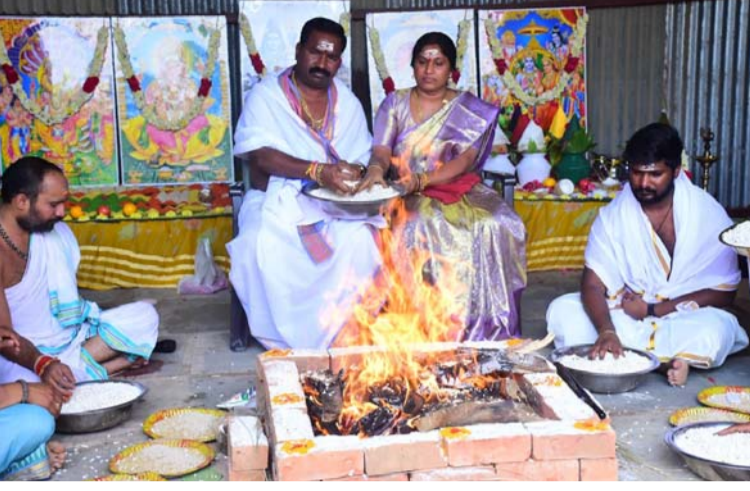
అక్షర విజేత, వికారాబాద్ ప్రతినిధి