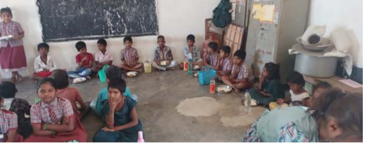
అక్షర విజేత, మోర్లాడ్ :