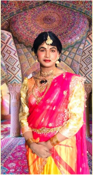
అక్షరవిజేత, వికారాబాద్ ప్రతినిధి

అంతర్జాతీయ మాతృభాషా దినోత్సవం సందర్భంగా తెలుగువారి భాషాని దేశ రాజధాని ఢిల్లీలో, రాష్ట్ర రాజధాని హైదరాబాద్ లో అజరామరం అనే తెలుగు చారిత్రాత్మక వద్ద నాటకం తో ఢిల్లీ ప్రజల హృదయాలలో పాటు మన తెలుగువారి హృదయాలలో కూడా నిలిచిపోయారు మన