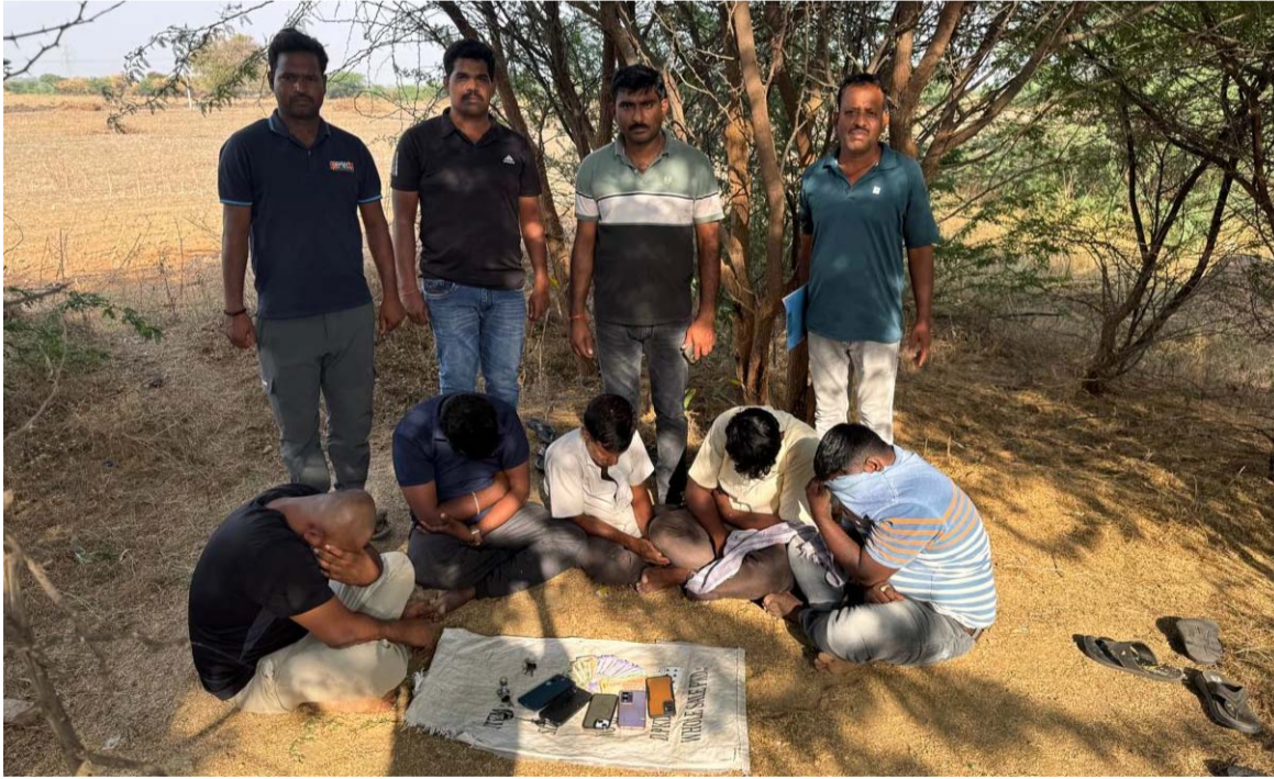
అక్షర విజేత గజ్వేల్ :

8,590 వేల రూపాయలు, 05 మొబైల్ ఫోన్లు, స్వాధీనం