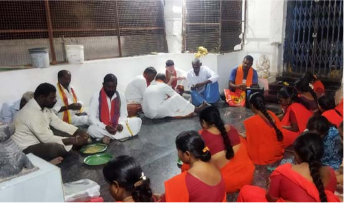
అక్షర విజేత, గణపూరం: