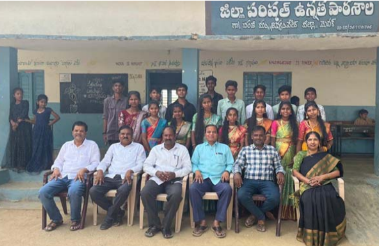
అక్షర విజేత శివంపేట.

శివంపేట మండల కేంద్రంలోని జిల్లా పరిషత్ ఉన్నత పాఠశాల చండి లో పదవ తరగతి విద్యార్థులు ఉపాధ్యాయులు గా