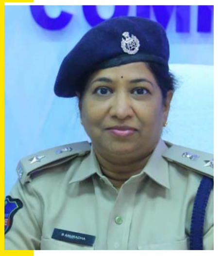
అక్షర విజేత సిద్దిపేట

08- తారీకు 03- నెల 2025 నాడు జాతీయ మెగా లోక్ అదాలత్ ఉన్నందున రాజీ పడ గగన కేసులలో క్రిమినల్ కంపౌండ్మెంట్ కేసులు, సివిల్ తగాదా