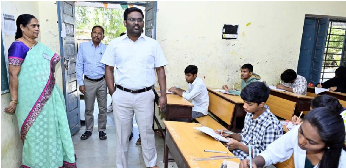
అక్రమ విజేత, నిజామాబాద్ ప్రతినిధి