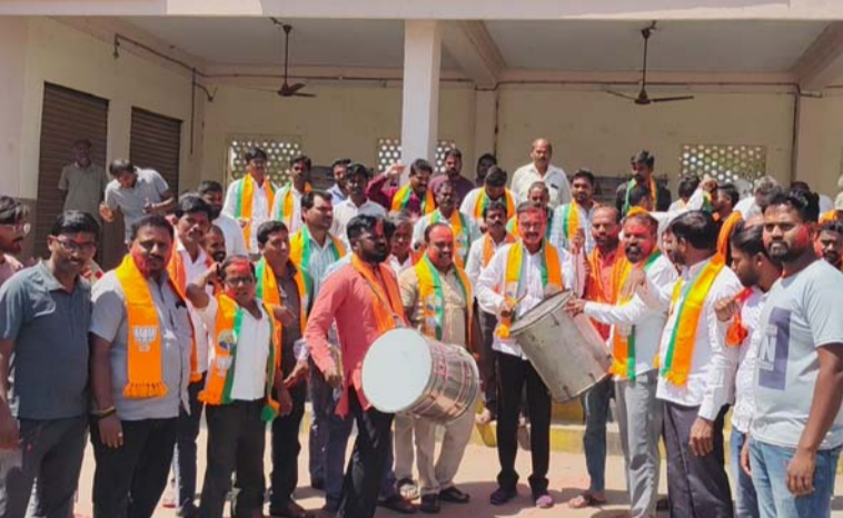
అక్షర విజేత: చిగురుమామిడి

కరీంనగర్ అదిలాబాద్ మెదక్ నిజామాబాద్ జిల్లాల పట్టణంల ఎమ్మెల్యే