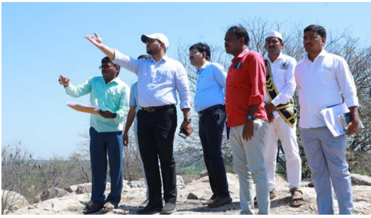
అక్షర విజేత గండేపల్లి

గండేపల్లి మండల పరిధిలోని గడ్డిపల్లి గ్రామంలో యంగ్ ఇండియా ఇంటిగ్రేటెడ్ రెసిడెన్షియల్ స్కూల్ నిర్మాణ ప్రాంతాన్ని, నవోదయ విద్యాలయం కొరకు కేటాయించిన స్థలాన్ని పరిశీలించిన జిల్లా