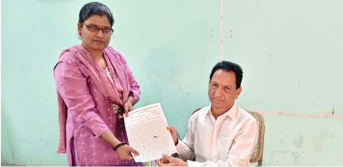
అక్రమ విజేత, నిజామాబాద్ ప్రతినిధి

అక్రమంగా అడ్మిషన్లు చేపడుతున్న పాఠశాలలను సీజ్ చేయాలి ఐసా విద్యార్థి సంఘం ఆధ్వర్యంలో ఎంఈవోలకు వినతి