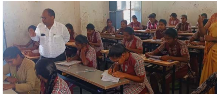
అక్షర విజేత, మోర్చాడ్

మండల కేంద్రంలోని కస్తూర్బా బాలికల పాఠశాలను తానిల్లార్ ఆంజనేయులు ఎంపీడీవో రాజు శ్రీనివాస్ గురువారం పరిశీలించారు. పాఠశాలలో పదవ తరగతి చదువుతున్న బాలికలకు శ్రీ పైనల్ ఎగ్జిక్యూటివ్ జరగడంతో వారు పరిశీలించారు. పాఠశాలలో ఫిర్యాదు బాక్కులను తెరిచి అందులో ఫిర్యాదు లేకపోవడంతో అనంతరం మధ్యాహ్నం భోజనం కూడా పరిశీలించి స్టాక్ రికార్డు అధికారులు పరిశీలించారు పదవ తరగతి పరీక్షల్లో బాగా చదివి ఉత్తమ ఫలితాలు సాధించాలని సూచించారు. ఈ కార్యక్రమంలో కస్తూర్బా పాఠశాల ఉపాధ్యాయులు పాల్గొన్నారు.