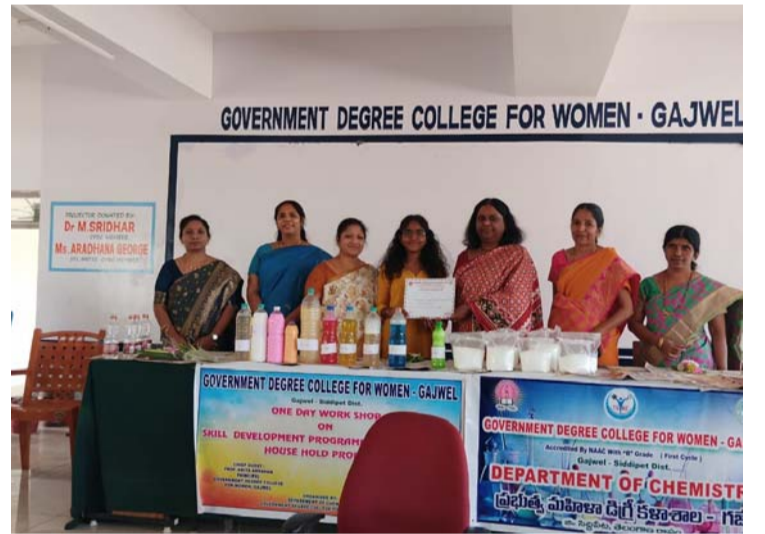
అక్షర విజేత గజ్వేల్: