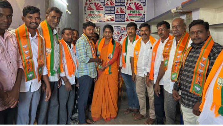
అక్షర విజేత గంజేపల్లి

ప్రధానమంత్రి నరేంద్ర మోడీ నాయకత్వంపై నమ్మకంతో గంజేపల్లి మండలం వెల్లడల గ్రామ యువకులు