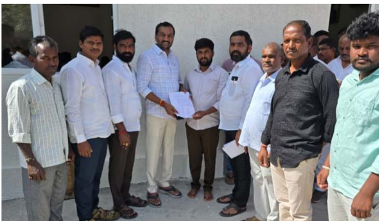
అక్షర విజేత గజ్వేల్ :

మరూక్ మండల కేంద్రంలో ఉన్న కొండపోచమ్మ సాగర్ లోకి నీటిని విడుదల చేసి సాగర్ నుండి కాలువల సహాయంతో శ్రీగిరిపల్లి, అంగడి కిష్టాపూర్, చేబర్తి చుట్టూ ఉన్న భూములకు నీటిని విడుదల చేసి రైతులను ఆదుకున్న ప్రభుత్వం. ఈ సందర్భంగా రైతులు మాట్లాడుతూ మెదక్ ఎంపీ రఘునందన్ రావు ను కలసి వినతి పత్రం అందజేయడం వల్ల ఎంపీ