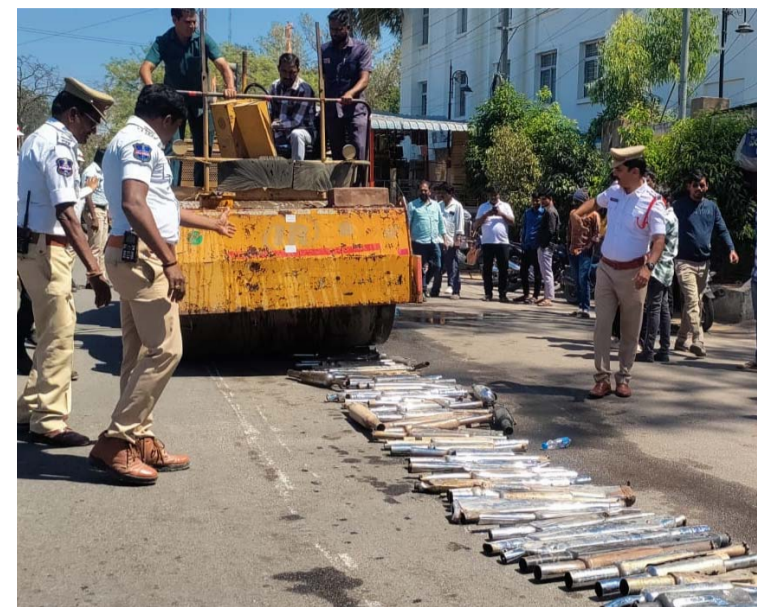
అక్రమ విజేత, నిజామాబాద్ ప్రతినిధి