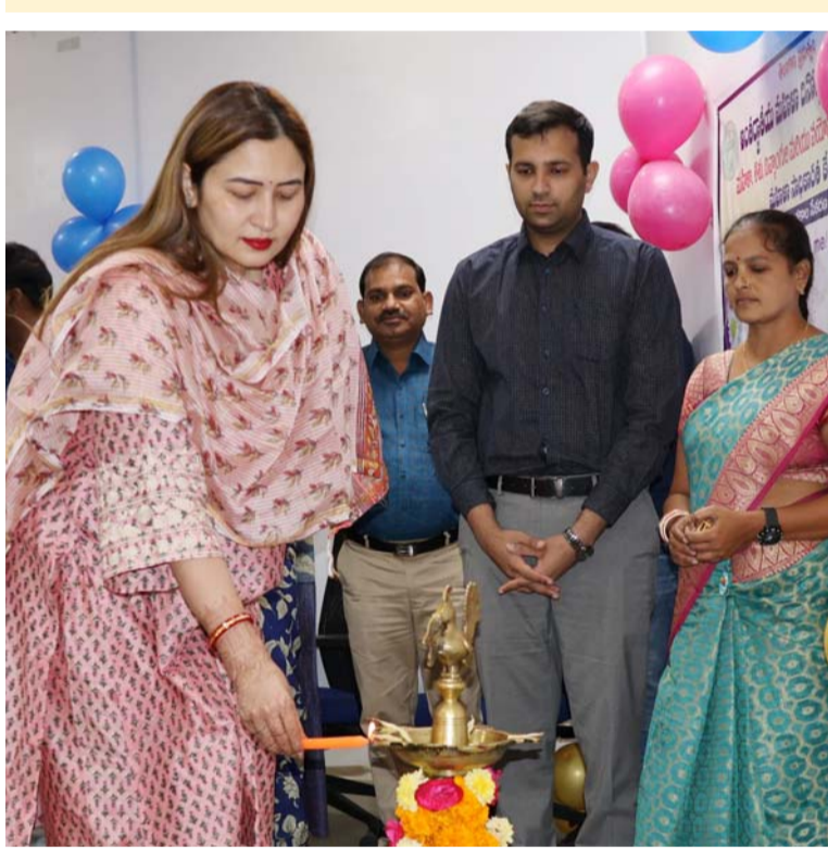
అక్షరవిజేత, వికారాబాద్ ప్రతినిధి

ప్రముఖ బ్యాట్మింటన్ క్రీడాకారిని, అర్జున అవార్డు గ్రహీత గుత్తా జ్యూల