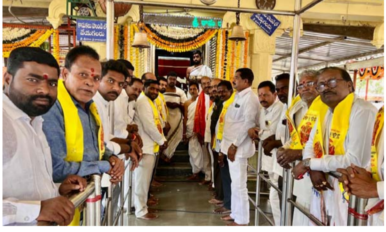
అక్షర విజేత గజ్వేల్:

సిద్దిపేట జిల్లా మర్నూక్ మండలం పాములపల్లి గ్రామంలోని శ్రీ సీతారామచంద్రస్వామి దేవాలయ వార్షిక బ్రహ్మోత్సవములు అంగంగం వైభవంగా ప్రారంభించారు. ఉదయం పెద్ద ఎత్తున భక్తులు పాల్గొని సుదర్శన చక్రాన్ని శ్రీ