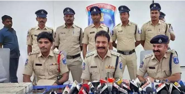
అక్షర విజేత రాజేంద్రనగర్

రాజేంద్రనగర్లో ఏడుగురు భూ కబ్జాదారులు అరెస్ట్.. నాలుగు కోట్ల రూపాయలు విలువ చేసే 600 గజాల స్థలం కబ్జా నకిలీ డాక్యుమెంట్ తో పాటు ఒక్క కోటి 69 లక్షలు నగదు మూడు కార్లు 7 మొబైల్ ను సీజ్