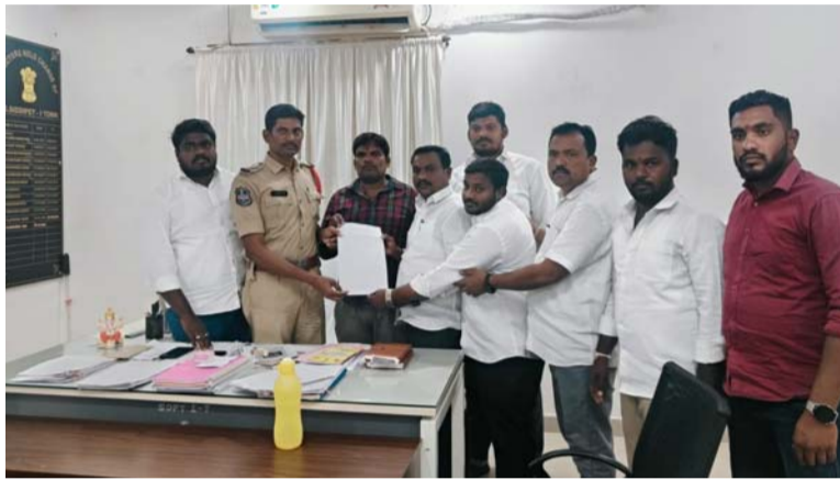
అక్షర విజేత సిద్దిపేట

మరియు అన్ని మండలాల లో ఫోటో మార్కింగ్ చేసిన వారిపై కఠిన చర్యలు తీసుకోవాలని పలు పోలీస్ స్టేషన్ ల లో పిర్యాదు చేయడం జరిగింది. కొందరు వ్యక్తులు నియోజకవర్గ ఇంచార్జి పూజల హరికృష్ణ రాజకీయ ఎదుగుదల ఓర్వలేక అతనిని రాజకీయంగా ఎదుర్కోలేక తప్పుడు ప్రచారాలు చేస్తూ తప్పుడు మార్కింగ్ ఫోటో లు చేస్తూ సోషల్ మీడియా లో పోస్టులు పెట్టి కాంగ్రెస్ పార్టీ మీద ఇంచార్జి పూజల హరికృష్ణ మీద తప్పుడు ప్రచారాలు చేస్తున్న వారి పై కఠిన