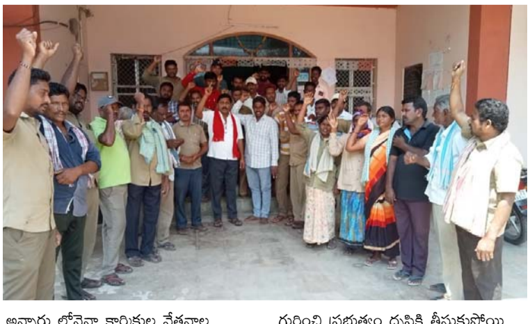
అన్నార లోనైనా కార్మికుల వేతనాల గురించి ప్రభుత్వం దృష్టికి తీసుకువాయి

నిబంధింపబడకుండా కార్మికులకి గ్రీన్ ఛానల్ ద్వారా నేరుగా కార్మికుల వేతనాలు చెల్లిస్తామని రాష్ట్ర ప్రభుత్వం ప్రతిష్ఠాత్మక ప్రకటన చేయటం తో కార్మికుల కుటుంబాల్లో ఆనందాలు జరుపుతున్నారని నిబంధింప జిల్లా నాయకులు అన్నారు జనవరి ఒకటో తారీకు నుండి ప్రతినెలా కార్మికుల వేతనాలు చెల్లిస్తామని హామీ ఇచ్చి ఆ హామీ ప్రకారం కార్మికులకు వేతనాలు చెల్లించడం లేదని యాకూట్ అన్నారు గత మూడు నెలలుగా ఇచ్చిన హామీని నిలబెట్టుకోవడంలో ప్రభుత్వం విఫలమైందని