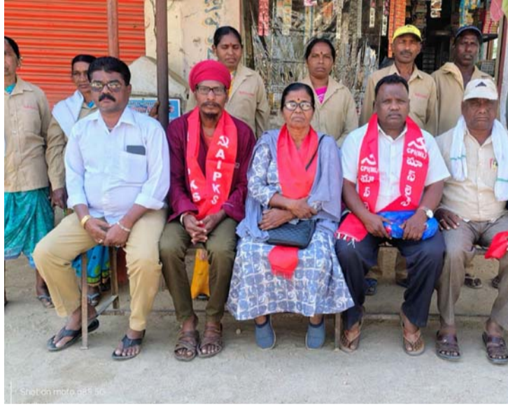
అక్షర విజేత, మోర్లాడ్ :