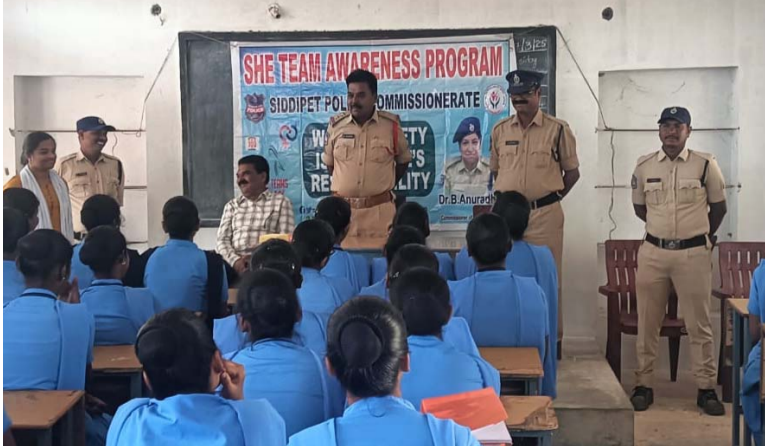
అక్షర విజేత సిద్దిపేట

శిక్షణ పూర్తి కాగానే ప్రభుత్వంలో లేక ప్రైవేట్ లో ఉద్యోగాలు చేసుకోవచ్చు ప్రేమ పెళ్లి అంటూ జీవితాలు నాశనం చేసుకోవద్దు ముందు ఉజ్జ్వలమైన భవిష్యత్తు ఉంది సైబర్ నేరాల పట్ల మీరు మీ కుటుంబ సభ్యులు అప్రమత్తంగా ఉండాలి