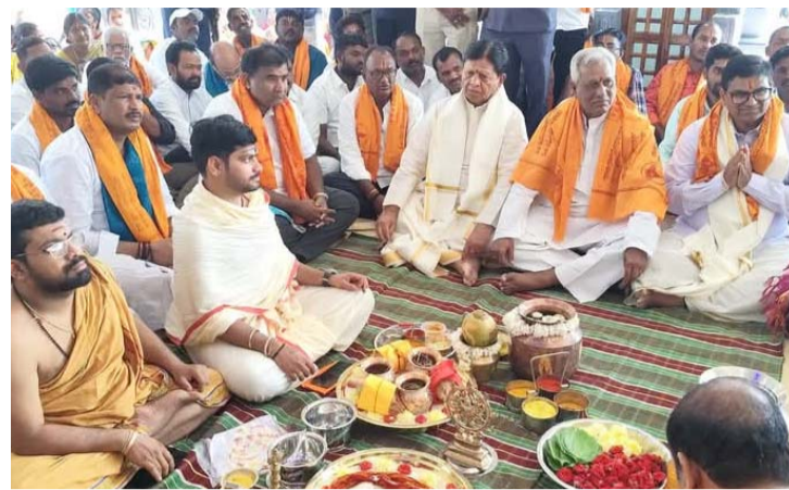
అక్షర విజేత, మోర్లాడ్