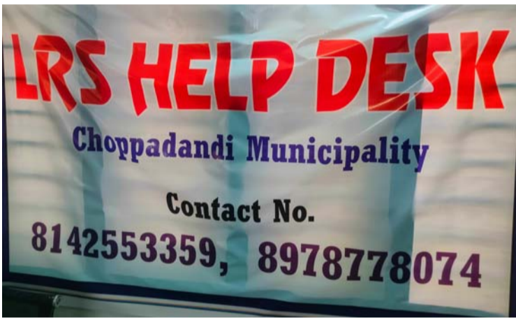
అక్షర విజేత, చొప్పదండి:

చొప్పదండి పుర ప్రజలకు, ప్లాట్ల యజమానులకు, ఎల్ఆర్ఎస్ సుసద్దానియోగం చేసుకోవడానికి 25% రాయితీ ఈనెల మార్చి 31 అవకాశం ఉందని మున్సిపల్ కమిషనర్ తెలిపారు , చొప్పదండి పట్టణ ప్రజల 2020 సంవత్సరములో వెయ్యి రూపాయలు చెల్లించి ఎల్ఆర్ఎస్ కొరకు రిజిస్టర్ చేసుకున్న ప్లాట్ల యజమానులకు అనుమతిలేని లే-అప్లైలోని ఖాళీ ప్లాట్లను రిగ్యులరైజ్ చేసుకొనుటకు తెలంగాణ ప్రభుత్వం 2025 నం. మార్చి 31 వరకు ఈ సడవకాణాన్ని కల్పించింది. అనుమతి లేని లే-అప్లైలో 10% ప్లాట్ల రిజిస్ట్రేషన్ అయి, మిగతా కానీ, వాటిని కూడా సబ్ రిజిస్టర్ వారి కార్యాలయము నందు రిజిస్ట్రేషన్ తో పాటు ఎల్ఆర్ఎస్ రుసుము కూడా చేల్చించి రిజిస్ట్రేషన్ చేసుకోవచ్చు. మార్చి 31వ తేదీ లోపల ఫీజు చెల్లించే వారికి 25% రాయితీ కూడా ప్రకటించింది.కావున, ఈ అవకాశం ప్రజలందరూ సద్దానియోగం చేసుకోగలరని కమిషనర్ తెలిపారు.