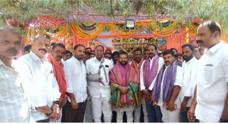
అక్షరవిజేత, వికారాబాద్ ప్రతినిధి