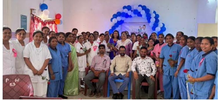
అక్షర విజేత, వేములవాడ / రాజన్న సిరిసిల్ల ప్రతినిధి :