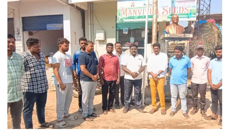
అక్షరవిజేత, రాయికల్ :