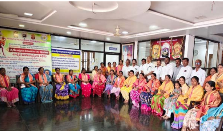
అక్షర విజేత, వేములవాడ / రాజన్న సిరిసిల్ల ప్రతినిధి :