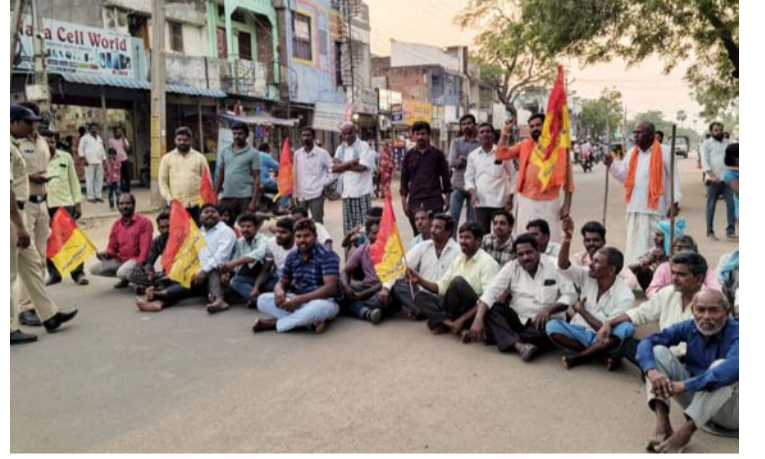
అక్షర విజేత, గణపవరం:

గణప సముద్రం సరస్సు పాలకవర్గం, కాంట్రాక్టర్ వైఖరిని నిరసిస్తూ శనివారం సాయంత్రం మత్స్య కార్మికులు మండల కేంద్రంలోని ప్రధాన రహదారిపై నిరసన వ్యక్తం చేశారు. శనివారం గణప సముద్రం సరస్సు సాఫైటి వరధిలోని మత్స్య కార్మికులు దక్షిణముఖ ఆంజనేయస్వామి దేవాలయం ప్రాంగణంలో సమావేశం నిర్వహించారు. ఈ సమావేశంలో పాలకవర్గం కాంట్రాక్టర్లు ఒకటై తమ పొట్టగొట్టాలని చూస్తున్నారని చెరువులో గతంలో ఉన్న చేపలను కాంట్రాక్టర్ తమతో పట్టించి అతి తక్కువ ధరకు తరలించేందుకు కుట్ర జరుగుతుందని కార్మికులు ఆరోపించారు. కాంట్రాక్టర్ పాలకవర్గం కనుసనల్లో చెరువులో చేసిన చేప పిల్లలు ఎదగలేదని కేవలం ఏడు నెలల్లో చేపలు పట్టడం సాధ్యం కాదని గతంలో ఉన్న చేపలని వారు తరలించుకపోయే ప్రయత్నం చేస్తున్నారని మత్స్య కార్మికులు ఆగ్రహం వ్యక్తం చేస్తున్నారు. ప్రకృతి వరప్రసాదంగా ఉన్న గణపసముద్రం సరస్సును కాంట్రాక్టర్ కు ధారా దత్తం చేయాలని చూస్తున్నారు. దీంతో వందలాది మత్స్య కార్మికులు కుటుంబాలకు తీరిన అన్యాయం జరుగుతుందని ఇప్పటికే 7 నెలలుగా చేపల పేటకు వెళ్లక తీవ్రంగా నష్టపోయామని ఆవేదన వ్యక్తం చేశారు. పాలకవర్గం నిర్ణయంతో మత్స్య కార్మికులు కుటుంబాలకు తీరిన అన్యాయం జరుగుతుందని ఆవేదన వ్యక్తం చేశారు. ఇప్పటికైనా స్థానిక ఎమ్మెల్యే, జిల్లా కలెక్టర్ లు స్పందించి తమకు న్యాయం చేయాలని ఈ సందర్భంగా కార్మికులు విజ్ఞప్తి చేశారు.