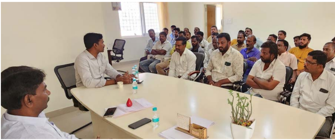
అక్షర విజేత సిద్దిపేట

సిసిఎస్ ఏసిపి యాదగిరి మాట్లాడుతూ ఎవరైనా దొంగ సొత్తును తీసుకొని వస్తే కొనవద్దని సూచించారు. ముఖ్యంగా ఈ మధ్యకాలంలో ట్రాన్సాకర్ పగలగొట్టి కాపర్ వైర్ తీసుకొని వెళ్లి దొంగలు దొంగతనంగా అమ్ముతున్నారని సమాచారం ఉన్నదని అలాంటి దొంగ సొత్తును కొనవద్దని సూచించారు. మరియు సెంట్రల్ డబ్బాలు కూడా జిల్లాలో అక్కడక్కడ దొంగతనాలు జరుగుతున్నాయని వాటిని కూడా కొనవద్దని తెలిపారు ఇవే కాకుండా మరే ఇతర దొంగ వస్తువులను