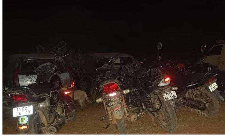
అక్షర విజేత: చిగురుమామిడి: