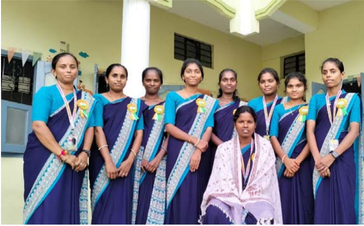
అక్షర విజేత, చొప్పడండి: