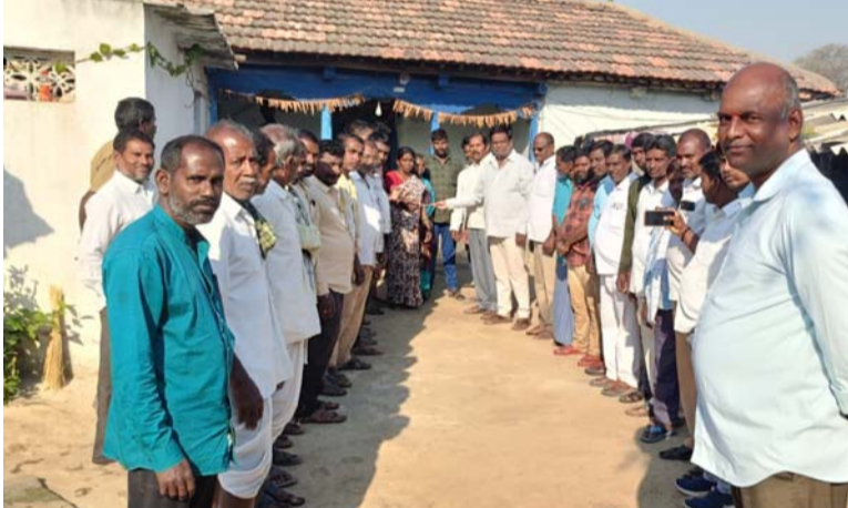
అక్షర విజేత, శివంపేట.