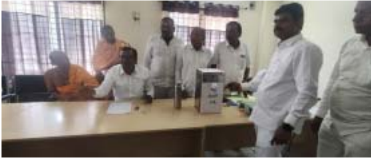
ఆదేశానుసారంగా తర్వాత మళ్ళీ టెండర్ నిర్వహిస్తామని ఈవో తెలిపారు.

తెలంగాణలోని ప్రముఖ పుణ్యక్షేత్రాల మల్లాల మండలం ముత్తంపేట గ్రామంలోని శ్రీ కొండగట్టు దేవస్థానానికి సంబంధించి 1 వ తేదీ ఏప్రిల్ 2025 నుండి 31 వ తేదీ మార్చి 2026 వరకు 13 రకాల పలు వ్యాపారాల నిర్వహణకు శుక్రవారం ఈ సెల్ టెండర్, బహిరంగ వేలం నిర్వహించగా కొద్దికొద్దిగా అమ్ముకునే హక్కు హెచ్చు పాట 1 కోటి 50 లక్షలు, పూలు పండ్లు 40 లక్షలు, గాజులు మరియు ప్లాస్టిక్ ఆట వస్తువులు 32 లక్షలు, పువ్వులు పేలాలు 27 లక్షలు 70 వేల హెచ్చు పాట దారులు దక్కించుకున్నారు. కొద్దికొద్దిగా ముక్కలు ఎరుకొనుటకు గత సంవత్సరం కంటే తక్కువ పొడినందున మళ్ళీ తిరిగి టెండర్ నిర్వహిస్తామని తెలిపారు. మిగతా వ్యాపారాలకు సంబంధించి కొన్నింటికి షెడ్యూల్ నగదును పాటదారులు కొందరు చెల్లించకుండా వేలంలో పాల్గొన్నానికి ఈవో శ్రీకాంత్ రావు అభ్యంతరం తెలపడంతో పాటదారులు ప్రతి సంవత్సరం టెండర్లు ఇలాగే నిర్వహిస్తున్నారని ముందుగా అడిగితే షెడ్యూల్ నగదును చెల్లించేవారిమని అధికారులు చెప్పిన విధంగానే తాము చేశామని తెలపగా 8 వ్యాపారాలకు టెండర్ ను తాత్కాలికంగా వాయిదా వేసి పై అధికారులతో సంప్రదించిన వారి