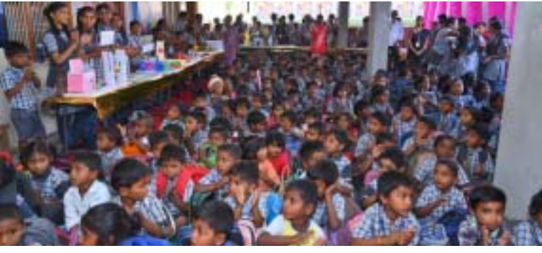
అక్షర విజేత అలంఫూర్/ అయిజ