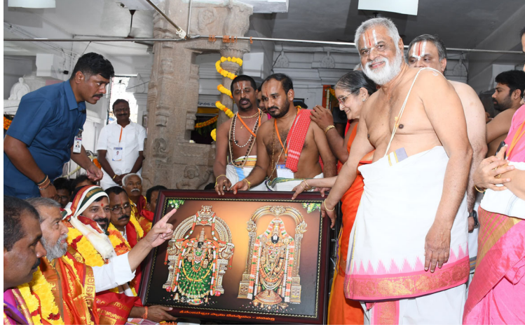
అక్షర విజేత వనపర్తి ప్రతినిధి.