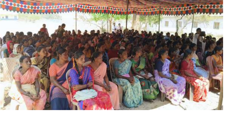
కట్టెం తోటి ముగిసింది. %ఎంబులవస% సంస్థ వారు మహిళాదినోత్సవం సందర్భం గా అందరికీ బహుమతులు ఇచ్చి వారిని ప్రోత్సహించడం జరిగింది