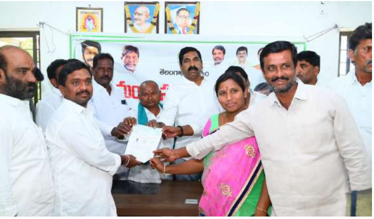
-కల్యాణలక్ష్మి షాదీ ముబారక్ చెక్కులు పంపిణీ చేసిన ఎమ్మెల్యే నాగరాజు అక్షర విజేత వర్ధన్నపేట

పార్టీలకు అతీతంగా సంక్షేమ పథకాలు అందించడమే కాంగ్రెస్ ప్రజా ప్రభుత్వ లక్ష్యమని వర్ధన్నపేట ఎమ్మెల్యే కేఆర్ నాగరాజు అన్నారు. శనివారం వర్ధన్నపేట పట్టణంలోని ఎమ్మెల్యే క్యాంపు కార్యాలయంలో వర్ధన్నపేట మండల, టౌన్ పరిధిలోని కల్యాణ లక్ష్మి, షాదీ ముబారక్ లబ్ధిదారులు 21 మందికి 21లక్షల 2 వేల 436 రూపాయల విలువ చెక్కులను, సీఎంఆర్ఎఫ్ లబ్ధిదారులకు సీఎంఆర్ఎఫ్ 33 చెక్కులు 8లక్షల 87వేల 500 రూపాయల విలువ గల చెక్కులను వర్ధన్నపేట ఎమ్మెల్యే కేఆర్ నాగరాజు పంపిణీ చేశారు. ఈ సందర్భంగా ఎమ్మెల్యే నాగరాజు మాట్లాడుతూ ఎల్ఓసీల ద్వారా ముఖ్యమంత్రి సహాయనిధి 60 మంది లబ్ధిదారులకు 2కోటి 25లక్షల 19 వేల రూపాయలు పంపిణీ చేయడం జరిగిందన్నారు. సీఎంఆర్ఎఫ్ చెక్కులు నియోజకవర్గ వ్యాప్తంగా దాదాపు 1500 చెక్కులు సుమారు 5కోట్ల 39 లక్షల రూపాయల చెక్కులను పంపిణీ చేయడం జరిగిందన్నారు. కల్యాణ లక్ష్మి, షాదీ ముబారక్ ద్వారా 1483 మంది లబ్ధిదారులకు 14 కోట్ల 84 లక్షల 72 వేల 28 రూపాయల చెక్కులను పంపిణీ చేయడం జరిగిందన్నారు. నిరుద్యోగ