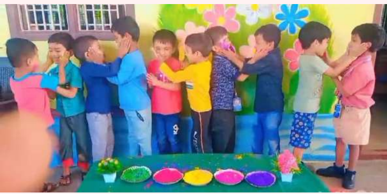
అక్షర విజేత మల్లాల కొండగట్టు