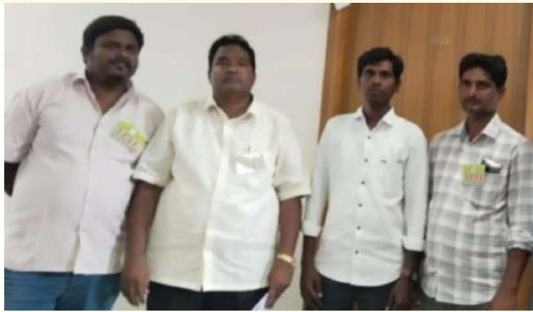
అక్షర విజేత ఖమ్మం: