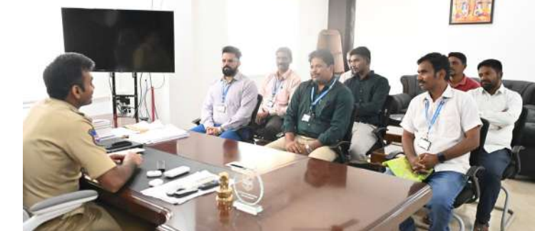
అక్షర విజేత ములుగు ప్రతినిధి: