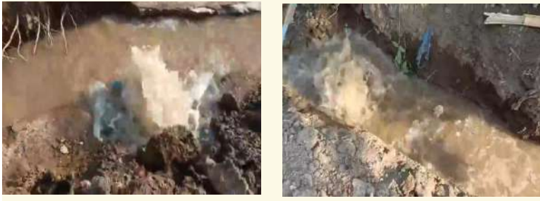
అక్షర విజేత కాగజ్ నగర్ ప్రతినిధి

కాగజ్ నగర్ పట్టణంలోని శ్రీరామ్ నగర్ కాలనీలో గత కొన్ని రోజులుగా మిషన్ భగీరథ పైవ్ లైన్ లీకేజీ అవుతుంది. దీంతో తాగునీరు కలుషితం అవుతుందని ప్రజలు వాపోతున్నారు.