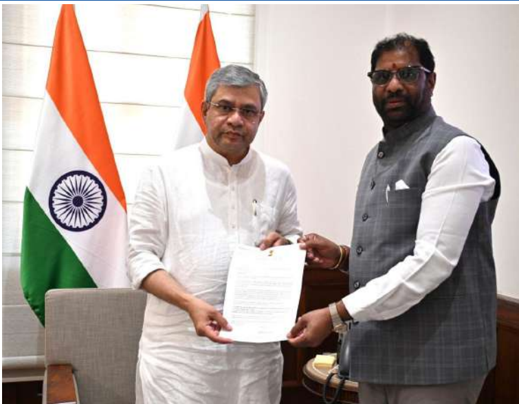
అక్షర విజేత ఖమ్మం :