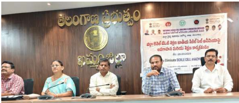
అక్షర విజేత ఖమ్మం: