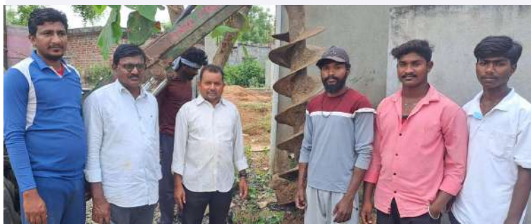
అక్షర విజేత ఎర్రపాలెం: