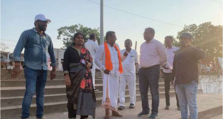
అక్షర విజేత ములుగు కొండగట్టు