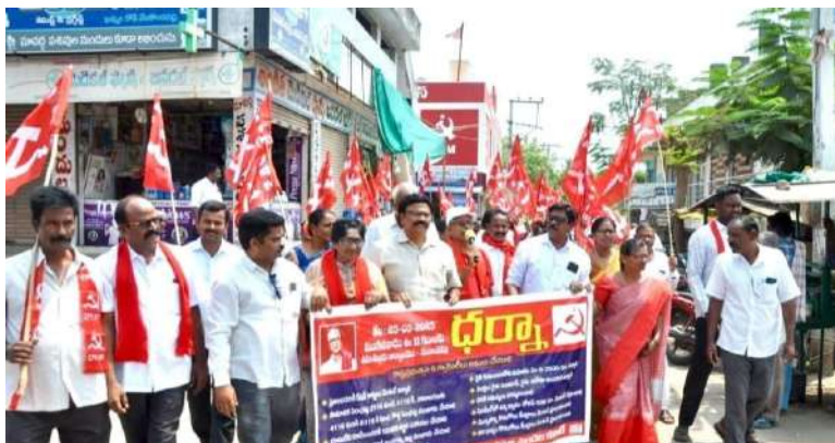
-నేలకొండపల్లిలో భారీ ప్రదర్శన -ఎం ఆర్ ఓ వివేక పత్రం అందజేసిన సిపిఎం నాయకులు