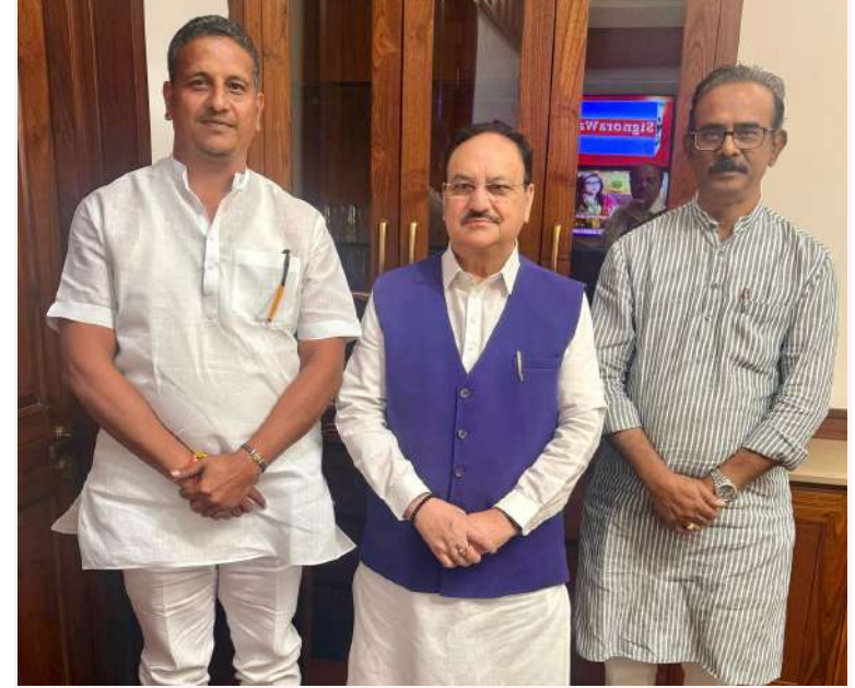
అక్షర విజేత, ఇబ్రహీంపట్నం :-