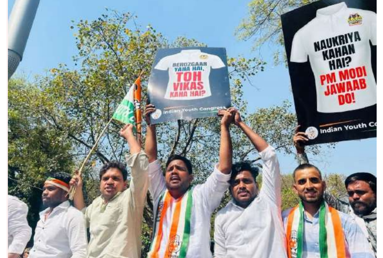
నేలకొండపల్లి అక్షర విజేత