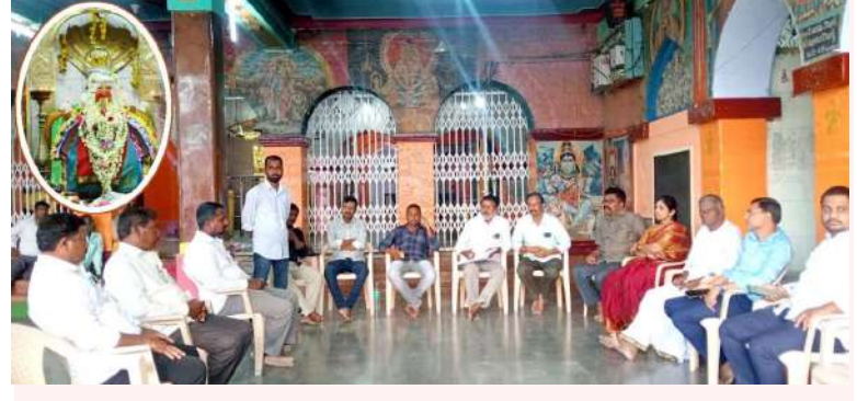
అక్షర విజేత, తాండూరు