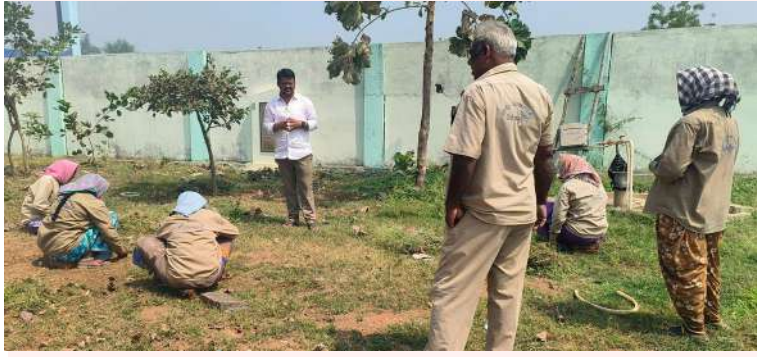
అక్షర విజేత ఎదులాపురం మున్సిపాలిటీ:-