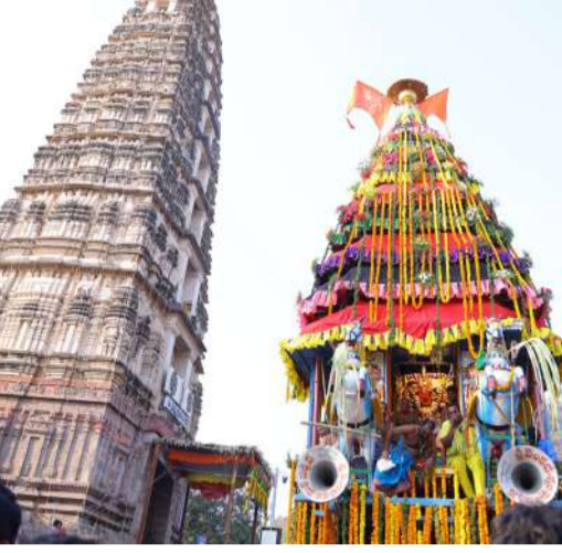
మంత్రి నారా లోకేశ్ గారితో కలిసి దివ్య రథోత్సవంలో పాల్గొన్న కేంద్ర సహాయ మంత్రి