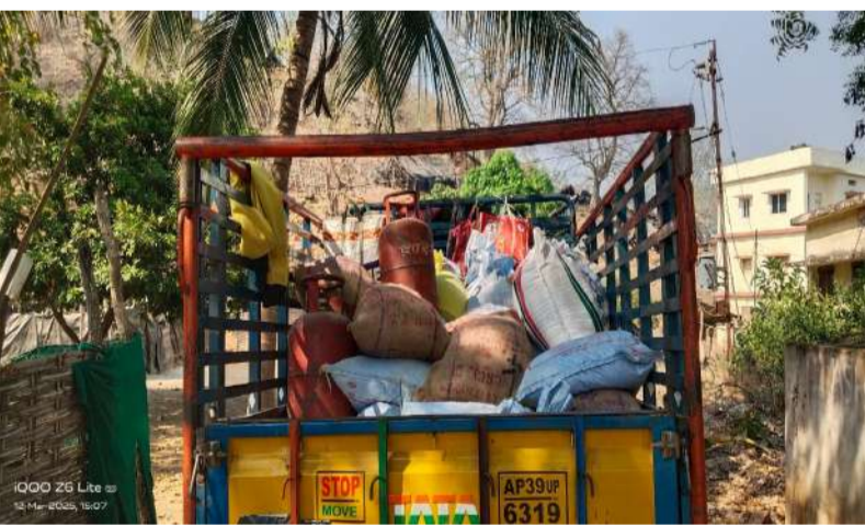
కిలో బియ్యం కోసం కిలోమీటర్లు వెళ్ళాల్సిన దుర్భర పరిస్థితి.