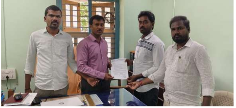
సింగల్ లైన్ రోడ్డు ప్రతిపాదన ఉపసంహరించుకోవాలి

అక్షర విజేత ఎమ్మిగనూరు :ఎమ్మిగనూరు లోనే ఆర్ అండ్ బి కార్యాలయంలో డీఈఈ (డిప్యూటీ ఎగ్జిక్యూటివ్ ఇంజనీర్)నారాయణం అర్ పి వి ఎఫ్, డి ఎన్ వై పి విద్వాల్య సంఘాల ఆధ్వర్యంలో