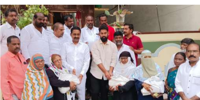
ముస్లింలకు నాలుగు శాతం రిజిస్ట్రేషన్ ఇచ్చిన ఘనత కాంగ్రెస్ పార్టీదే అని అన్నారు. మహ్మద్ ప్రవక్త ద్వారా దివ్య ఖురాన్ ఆవిష్కరించిన ఈ రంజాన్ మాసంలో నెల రోజులపాటు ఎంతో