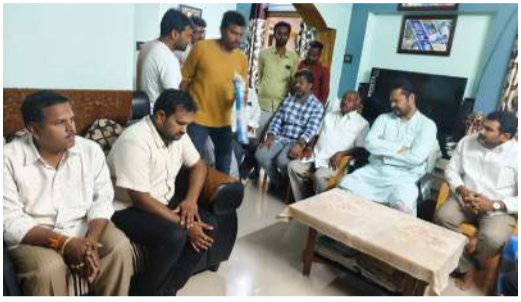
అక్కిల విజేత కోటనందూరు:కాకినాడ జిల్లా, తుని నియోజకవర్గం