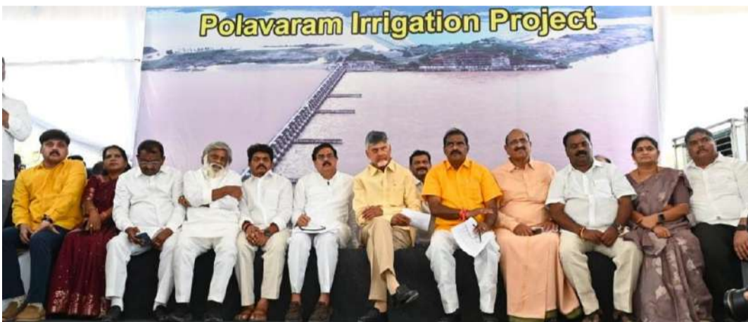
విడుదల చేస్తాం - దళారులు, మోసగాళ్లకు అవకాశం లేకుండా చేస్తాం - పోలవరంలో నీళ్లు వదిలే ముందే పునరావాసం పూర్తి చేస్తాం - మన ఎన్నికే ప్రభుత్వం వచ్చింది.. సకాలంలో పూర్తి చేసుకుందాం - రూ.829 కోట్లు నేరుగా నిర్మాణం భాషాల్లోకి వేసిన ఘనత మాది అని సీఎం చంద్రబాబు అన్నారు ఎల్లీ పరిస్థితుల్లో 2027 పోలవరం పూర్తి చేస్తామని ఆయన అన్నారు

అక్షర విజేత, పోలవరం: రైతులకు మొదట్లో చాలా తక్కువ పరిహారం ఇచ్చారు - నిన్న మొన్నటి వరకూ నిర్మాణంతో పట్టుకున్న నాథుడు లేదు - పోలవరం పూర్తి కావడం ఏడు మందలాలు ఏపీటీ కలపాలని అప్పట్లో మోదీని డిమాండ్ చేశాను - జగన్ ప్రతిపక్షంలో ఉన్నప్పుడు రూ.10 లక్షలు పరిహారం ఇస్తానన్నారు - జగన్ అధికారంలోకి వచ్చాక పైసా కూడా విడిచిపెట్టలేదు - వరదలు వచ్చినప్పుడు కూడా అప్పుడీ సీఎం జగన్ పట్టించుకోలేదు - ఎప్పుడో పూర్తి కావాల్సిన ప్రాజెక్టును జగన్ పక్కపెట్టారు - 2019లోనూ డిడిపీ అధికారంలోకి వచ్చి ఉంటే పోలవరం ఎప్పుడో పూర్తయ్యేది - అలాంటి కావడంతో పోలవరం ఖర్చు భారీగా పెరిగిపోయింది - నేను సోమవారాన్ని పోలవరం మార్చుకుని పనిచేశా - ఇదేళ్లలో 33 సార్లు పోలవరాన్ని నందర్పించాను - వీలైనంత త్వరగా పరిహారం ఇచ్చే ప్రయత్నం చేస్తాం - కొందరి పేర్లు తొలగించారని బాధితులు చెబుతున్నారు - పేర్లు తొలగించువై విచారణ జరిపించి తగిన చర్యలు తీసుకుంటాం - 2027 నాటికి పునరావాసాన్ని పూర్తి చేస్తాం - పునరావాసాన్ని ఇచ్చిన తర్వాత ప్రాజెక్టుకు నీటిని