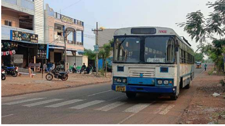
అక్షర విజేత, వికారాబాద్ ప్రతినిధి

వికారాబాద్ డిపోకు చెందిన పరిగి వెళ్లే బస్సు సాంకేతిక లోపంతో కలెక్టరేట్ దగ్గర మంగళవారం ఉదయం ఆగిపోయింది. కండక్టర్ ప్రయాణికులను కిందికి దించివేసింది. దీంతో ప్రయాణికులు తీవ్ర ఇబ్బందులు పడుతున్నారు. ఆర్టీసీ అధికారులపై ప్రయాణికులు మండిపడుతున్నారు. వికారాబాద్ డిపోకు వచ్చిన కొత్త బస్సులను ఇతర డిపోలకు పంపి వికారాబాద్ డిపోలో మాత్రం పాత బస్సులతోని కాలం వెళ్లదీస్తున్నారని ఆగ్రహం వ్యక్తం చేస్తున్నారు. వికారాబాద్ డిపోకు 16 కొత్త బస్సులను స్వీకర్ తెప్పించారు. కానీ ఆర్టీసీ అధికారులు కొత్త బస్సులను ఇతర డిపోలకు పంపించడం పట్ల ప్రజలు విస్మయం వ్యక్తం చేస్తున్నారు. వికారాబాద్ డిపోలో నిత్యం సాంకేతిక లోపంతో బస్సులు ఆగిపోవడంతో ప్రయాణికులు ఇబ్బంది పడుతూ ఉన్నారు. ఉన్నత అధికారులు చొరవ తీసుకొని డొక్కు బస్సుల స్థానంలో నూతన బస్సులను తెప్పించాలని ప్రయాణికులు కోరుతున్నారు.