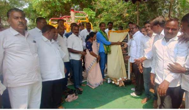
అక్షర విజేత, రాయికల్: