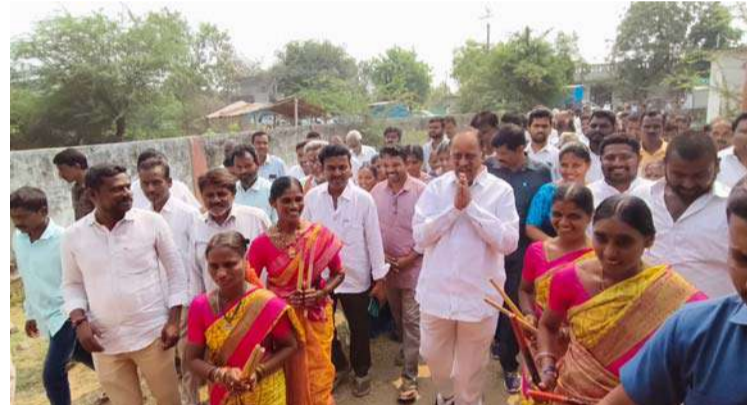
అక్షర విజేత సంగెం

మంగళవారం సంగెం మండల కేంద్రంలో తెలంగాణ రాష్ట్ర ప్రభుత్వం ప్రతిష్టాత్మకంగా ప్రవేశపెట్టిన సన్న బియ్యం పథకాన్ని పరకాల శాసనసభ్యులు రేవంత్ రెడ్డి ప్రారంభించారు. ఈ సందర్భంగా ఎమ్మెల్యే మాట్లాడుతూ దారిద్ర్య రేఖకు దిగువన ఉన్న తెల్ల రేషన్ కార్డు కలిగిన కుటుంబాలకు నేటి నుండి సన్న బియ్యం పంపిణీ చేస్తున్నామని అన్నారు. ప్రజల జీవన ప్రమాణాలు పెంపొందించేందుకు కాంగ్రెస్ ప్రజా ప్రభుత్వం కృషి చేస్తుందన్నారు. పేద ప్రజల సంక్షేమం వారి ఆర్థిక అభివృద్ధి లక్ష్యంగా తమ ప్రభుత్వం పనిచేస్తుందన్నారు. చారిత్రక పట్టణంలో నిలిచేది పేద ప్రజలకు సన్న బియ్యం పంపిణీ కార్యక్రమం అని, దీనిని మార్కెట్ ధరలో రాబోయే ఏ ప్రభుత్వానికీ లేదన్నారు. తెల్ల రేషన్ కార్డు కలిగిన కుటుంబాలకు సంబంధించి ప్రతి ఒక్కరికీ 6 కిలోల కొప్పున సన్న బియ్యం పంపిణీ ఇస్తున్నామని తెలిపారు. ఎన్ని ఆర్థిక ఇబ్బందులు ఉన్న సన్న బియ్యం పథకాన్ని ఎన్నికల ముందు ఇచ్చిన మాట మేరకు రాష్ట్రవ్యాప్తంగా పంపిణీ చేస్తున్నామన్నారు. 10 సంవత్సరాల పాలన చేసిన బిఆర్ఎస్ ప్రభుత్వం సన్న బియ్యం ఇవ్వకుండా ప్రజలను మోసం చేసిందన్నారు. పేదలకు సన్న బియ్యం పథకాన్ని ప్రవేశపెట్టినందుకు ముఖ్యమంత్రి రేవంత్ రెడ్డి, ఉప ముఖ్యమంత్రి బట్టి విక్రమార్కు పౌరసరఫరా శాఖ, మంత్రి ఉత్తంకుమార్ రెడ్డి, పరకాల నియోజకవర్గ ప్రజల తరఫున ప్రత్యేక ధన్యవాదాలు తెలిపారు.