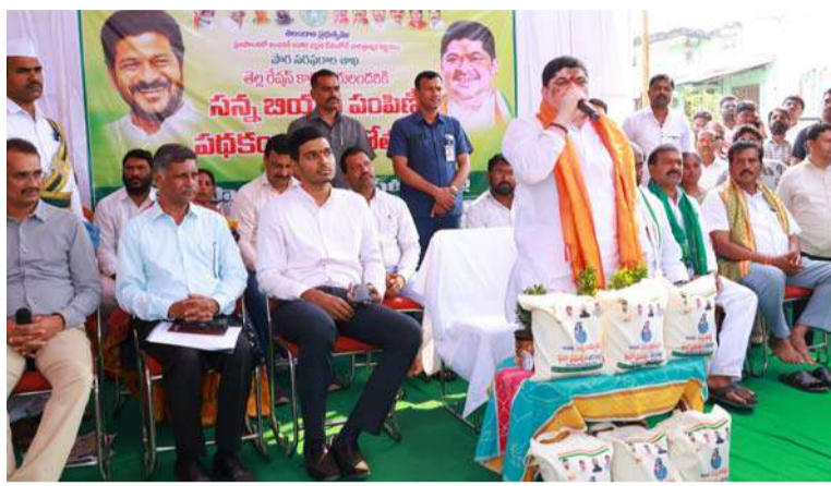
అక్షర విజేత సిద్దిపేట

మంత్రి మాట్లాడుతూ రాష్ట్ర మొత్తం 17263 చౌక ధరల దుకాణాల్లో 2 లక్షల 91 వేల కుటుంబాలకు సన్న బియ్యం పంపిణీ కార్యక్రమం మొదలుపెట్టాం. రాష్ట్ర ప్రభుత్వం అత్యంత ప్రతిష్టాత్మకంగా తీసుకుని రాష్ట్ర ముఖ్యమంత్రి చేతుల మీదుగా ఉగాది రోజున ప్రారంభించాం. రేషన్ షాప్ లలో సన్న బియ్యం పంపిణీ అనే ప్రక్రియ ఒక చారిత్రాత్మకమైనది. దేశం లో ఎక్కడా లేనటువంటి ఒక బృహత్ కార్యక్రమం ఇది. నిరుపేద ప్రజలు ఆరోగ్యంగా ఉండడం కోసం మారుతున్న కాలానికి అనుగుణంగా నిరుపేదల సైతం సన్న బియ్యం తింటూ ఆరోగ్యంగా ఉండాలని సూచించారు. మా ప్రభుత్వం మహిళా సంఘాలకు సంబంధించి కోటిమంది మహిళలను కోటివ్వలను చేయడం కోసం ఎంతగానో కృషి చేస్తున్నాం. గ్యాస్ సంబంధించి 500 రూపాయలకే సిలిండర్ అందజేస్తున్నాం. ఆర్డీని బస్సుల లో మహిళలు ఉచిత