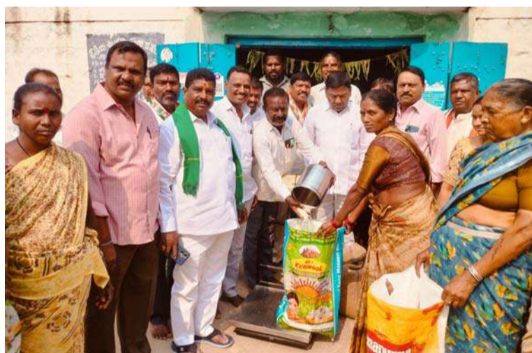
అక్షర విజేత మహేశ్వరం