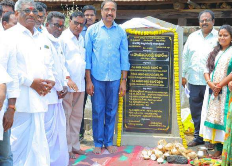
అక్షర విజేత, రాయికల్: