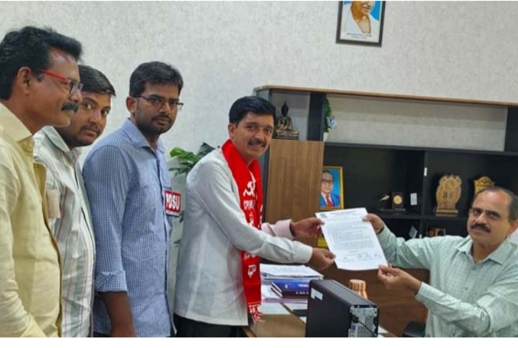
అక్షర విజేత, నిజామాబాద్ ప్రతినిధి : హైదరాబాద్ సెంట్రల్ యూనివర్సిటీ