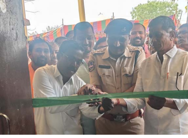
అక్షర విజేత సందిపేట్ :