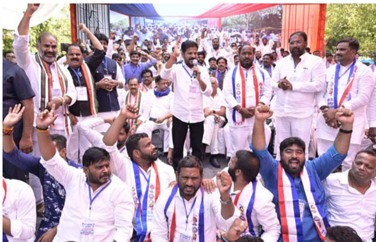
అక్షర విజేత, వేములవాడ / రాజన్న సిరిసిల్ల ప్రతినిధి :