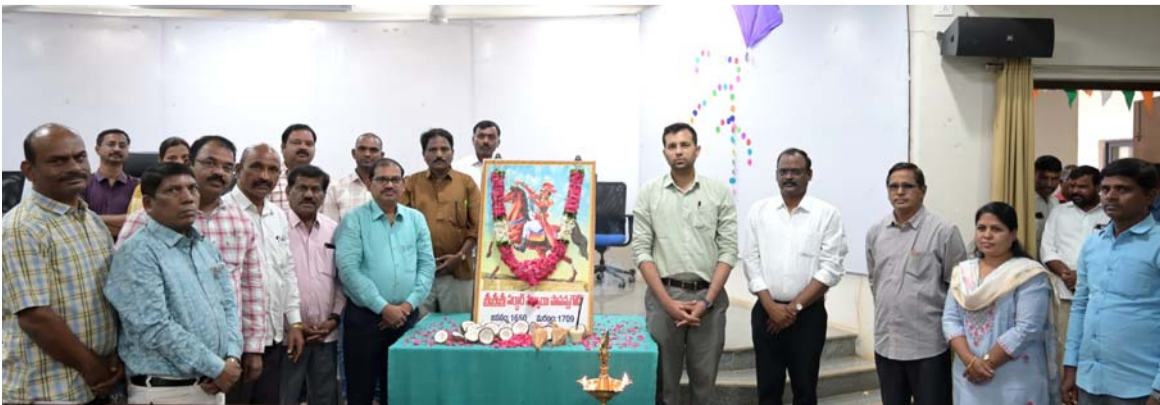
మాట్లాడుతూ బహుజన రాజ్యాన్ని స్థాపించిన మొట్ట మొదటి మహా యోధుడు సర్దార్