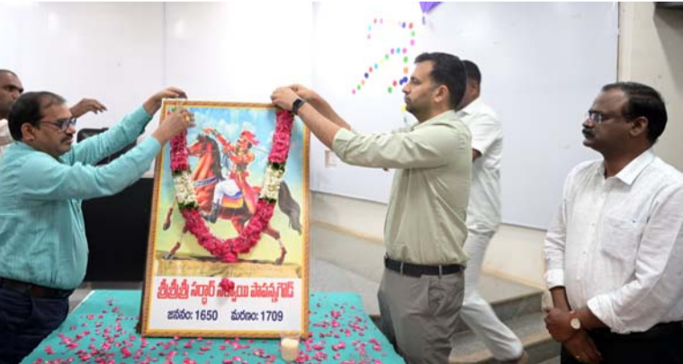
అక్షర విజేత, వికారాబాద్ ప్రతినిధి