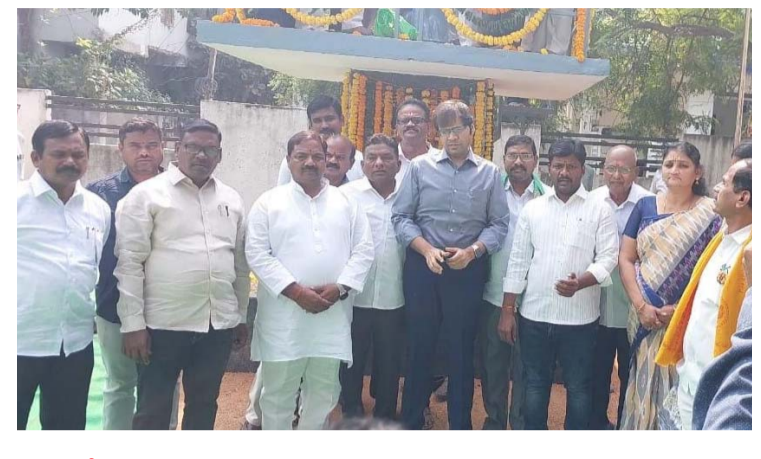
అక్షర విజేత, నిజామాబాద్ ప్రతినిధి :

బీ.సీ సంక్షేమ శాఖ అధ్యక్షులలో వర్ధంతి వేడుకలు