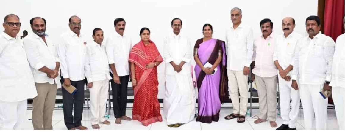
అక్షర విజేత గజ్వేల్:

బీఆర్ఎస్ పార్టీ రజతోత్సవ మహాసభ ఏర్పాటు నేపథ్యంలో ఉమ్మడి మెదక్, నిజామాబాద్ జిల్లాల ముఖ్యనేతలతో పార్టీ అభినేత కే.చంద్రశేఖర్ రావు బుధవారం