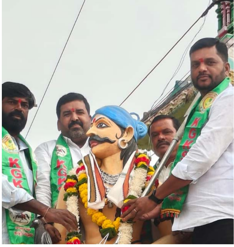
అక్షర విజేత, కొమురవెల్లి (02 ఏప్రిల్ 2025):