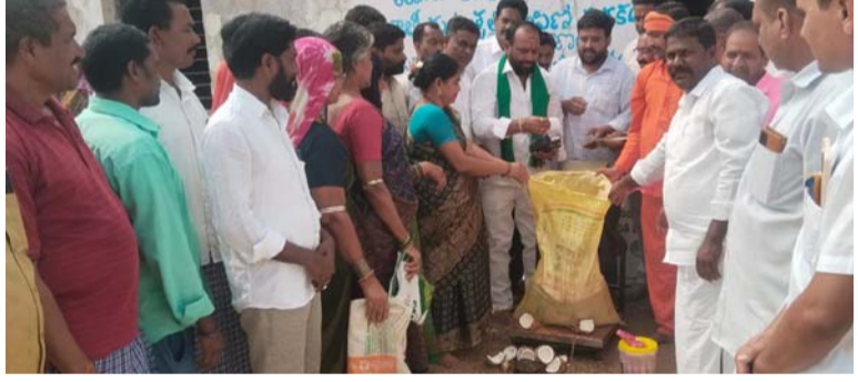
అక్షర విజేత, రుద్రంగి / రాజన్న సిరిసిల్ల ప్రతినిధి :