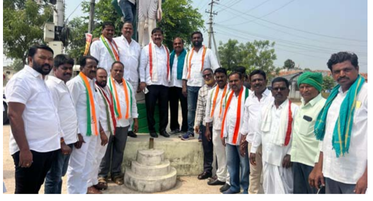
అక్షర విజేత నందిపేట్ :