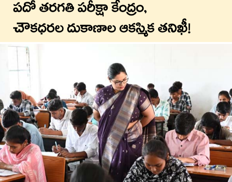
పదో తరగతి పరీక్షా కేంద్రం, చౌకధరల దుకాణాల ఆకస్మిక తనిఖీ!

అక్షరవిజేత మామడ: పదవ తరగతి పరీక్షల వివర రోజైన బుధవారం మామడ మండల కేంద్రంలోని ప్రభుత్వ ఉన్నత పాఠశాలలోని పదవ తరగతి పరీక్షా కేంద్రాన్ని ఆకస్మికంగా తనిఖీ చేశారు. పరీక్షల నిర్వహణ తీరును, నిశితంగా పరిశీలించారు. విద్యార్థుల