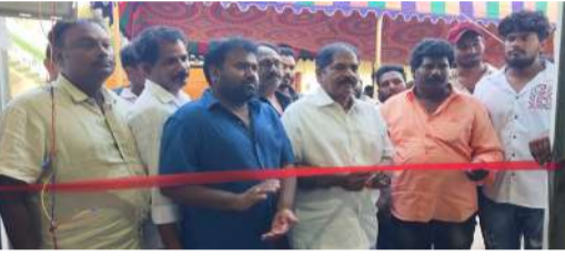
సమాజ సేవలో అందరూ భాగస్వాములు కావాలి..